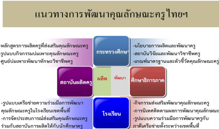
ภาพประกอบ 3 แนวทางการพัฒนาครูไทย

กระทรวงศึกษาธิการ ในฐานะหน่วยงานกลาง ที่รับผิดชอบงานด้านการศึกษา การผลิตและพัฒนาครู ควรมีแนวทางการพัฒนาคุณลักษณะครู ในประเด็นต่าง ๆ ดังนี้