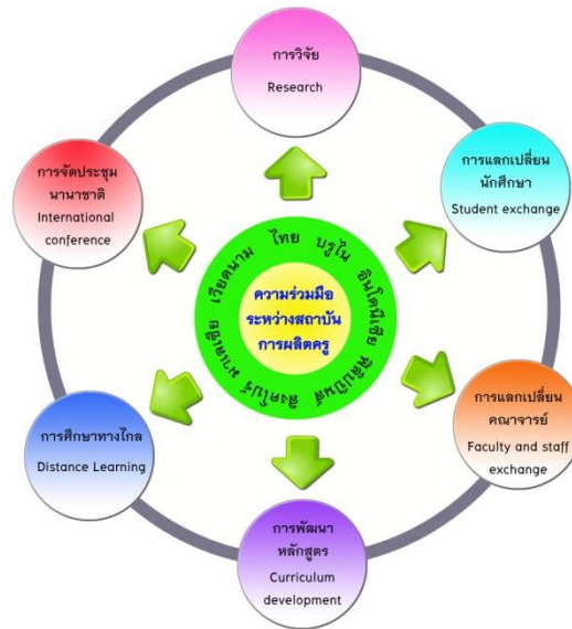
รูปแบบความร่วมมือระหว่างสถาบันการผลิตของกลุ่มประเทศอาเซียน