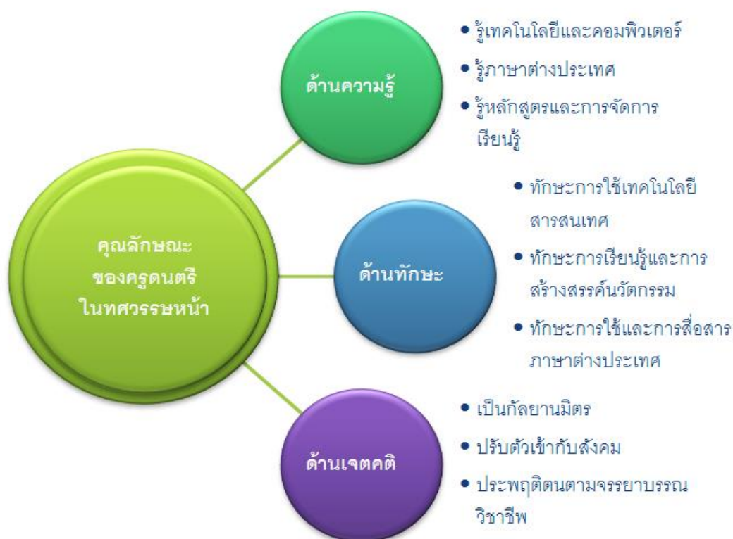
ภาพประกอบ 2 อนาคตภาพของคุณลักษณะครูดนตรี ในทศวรรษหน้า (พ.ศ.2561-2571)

1. อนาคตภาพของคุณลักษณะครูดนตรี ในทศวรรษหน้า ที่มีความเป็นไปได้มากที่สุด (Most-probable scenario)