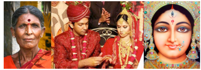
ภาพที่ 2 แสดงภาพของ “จุดแดง” หรือ “บดินตี” สัญลักษณ์ทางประเพณีของชาวอินเดีย

กรณีศึกษาจุดแดงบนตี : ทางเลือกแห่งตัวตนของหญิงชาวอินเดีย