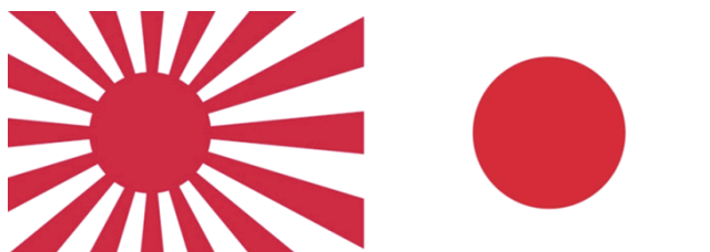
ภาพที่ 4 แสดงภาพของ “จุดแดง” ที่ปรากฏอยู่บนธงชาติของประเทศญี่ปุ่น ที่มา:

กรณีศึกษา จุดกลมบนผืนธงญี่ปุ่น : มโนภาพดวงตะวันแห่งสงครามกับจันทรภาพแห่งศาสนา