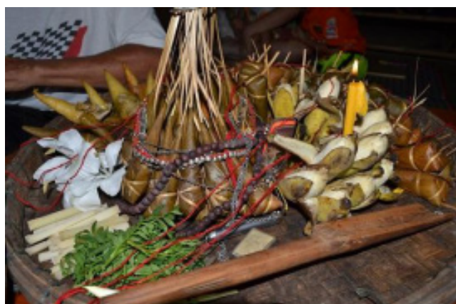
ภาพที่ 1 เครื่องเซ่นไหว้ของพิธีกรรมเรียกขวัญ ในประเพณีกินข้าวห่อ

ที่สุด เนื่องจาก “ขวัญ” ถูกเรียกเป็นครั้งที่สอง มีการใช้ด้ายแดงจุ่มน้ำฝนก่อนผูกแขนให้ขวัญกลับเข้าร่างเจ้าของ รวมถึงมีดอกมหาหงส์ในพิธี ส่วนเครื่องเซ่นไหว้ในช่วงที่ 3 (หลังจากผูกแขนด้วยด้ายแดง) ประกอบด้วย กล้วย อ้อย ข้าวห่อ ดอกมหาหงส์ และยอดดาวเรืองในภาพที่ 2 เมื่อเจ้าพิธีเรียกขวัญเรียบร้อยแล้วจะนำเครื่องเซ่นไหว้ดังกล่าววางไว้ที่ศีรษะของผู้รับขวัญก่อนนำไปเก็บไว้ที่หัวเตียง