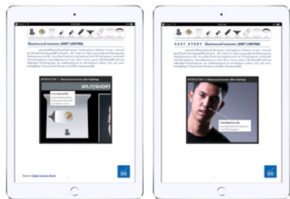
ภาพที่ 1 ชุดการสอนมินิคอร์สบนระบบปฏิบัติการ iOS เรื่องการถ่ายภาพในสตูดิโอ

3. แบบทดสอบวัดผลสัมฤทธิ์ทางการเรียน สร้างแบบทดสอบแบบ 4 ตัวเลือกให้ครอบคลุมเนื้อหาและวัตถุประสงค์ นำแบบทดสอบไปให้ผู้เชี่ยวชาญตรวจสอบความถูกต้องเหมาะสม และความสัมพันธ์ระหว่างแบบทดสอบแต่ละข้อกับวัตถุประสงค์ทำการปรับปรุงแก้ไขแบบทดสอบเพื่อให้เกิดความสมบูรณ์ยิ่งขึ้น นำแบบทดสอบไป