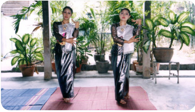
ภาพที่ 10 ท่าที่ 8 ท่าจับต่อข้อศอก