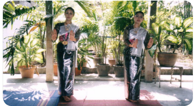
ภาพที่ 15 ท่าที่ 13 ท่าตั้งวงล่าง