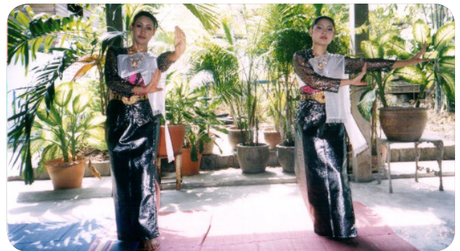
ภาพที่ 16 ท่าที่ 14 ท่าแขนตั้งต่อข้อศอก ที่มา: รจนา สุนทรานนท์, 2547 : 36.