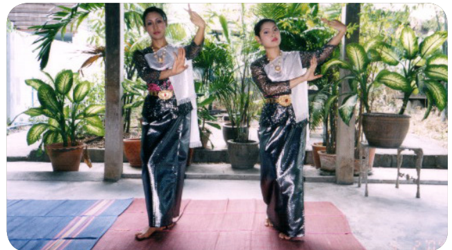
ภาพที่ 8 ท่าที่ 6 ท่าม้วนจิบระดับวงบน