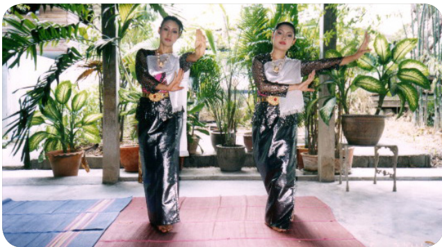
ภาพที่ 12 ท่าที่ 10 ท่าแขนตั้งต่อข้อศอก