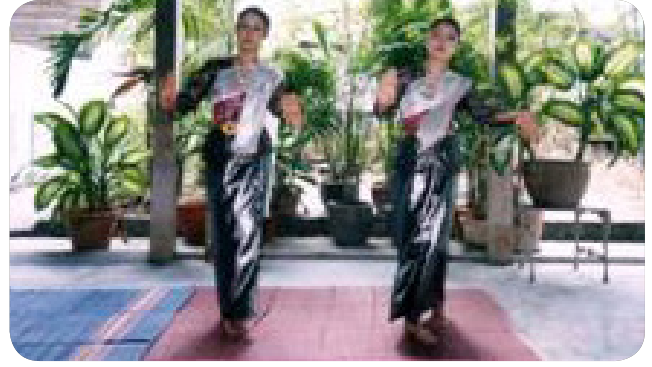
ภาพที่ 14 ท่าที่ 12 ท่าตั้งวงหยายฝ่ามือ ที่มา: รจนา สุนทรานนท์, 2547 : 34.