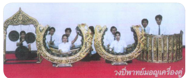
ภาพที่ 2 ภาพวงปี่พาทย์มอญ

ปี่พาทย์มอญมีเครื่องดนตรีเช่นเดียวกับวงปี่พาทย์ไทยทั่วไปแต่ใช้ฆ้องวงคนละแบบ คือ ใช้ฆ้องวงมอญ (รูปโค้งขึ้น) แทนฆ้องวงไทย ทั้งฆ้องวงมอญวงใหญ่ วงกลางและวงเล็ก และใช้ตะโพนมอญซึ่งมีขนาดใหญ่กว่าแทนตะโพนไทย ใช้ปี่มอญที่มีขนาดใหญ่กว่า ทำให้เสียงก้องและกังวานกว่า ทุ่มเศร่ากว่าแทนปี่ใน และมีเปิงมางคอกเข้ามาประกอบด้วย โดยบรรเลงได้ทั้งทำนองและจังหวะ ปี่พาทย์มอญแบ่งออกเป็นขนาดต่างๆ ซึ่งแล้วแต่จำนวนเครื่องดนตรีที่ใช้ เช่น ปี่พาทย์มอญวงเล็ก ปี่พาทย์มอญเครื่องคู่ และปี่พาทย์มอญเครื่องใหญ่ เป็นต้น บางคราวมีการเพิ่มฆ้องวงมอญเข้าไปในวงเป็นจำนวนมากถึง 7 โคน 10 ตามแต่เจ้าภาพเพื่อเป็นเกียรติศักดิ์ศรีแก่ผู้ถวายชนม์