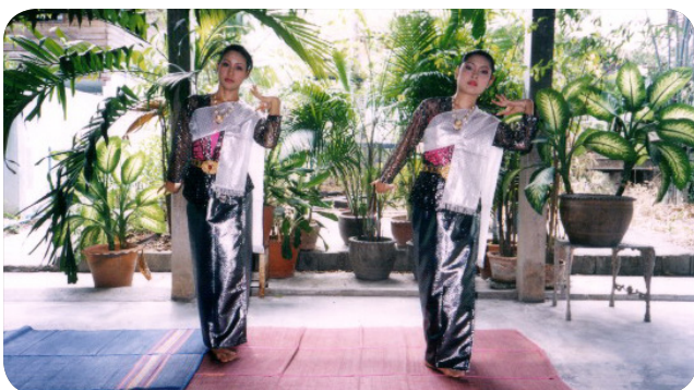
ภาพที่ 13 ท่าที่ 11 ท่าจับคว้านฐานไหล่และจับยาว ที่มา: รจนา สุนทรานนท์, 2547 : 33.