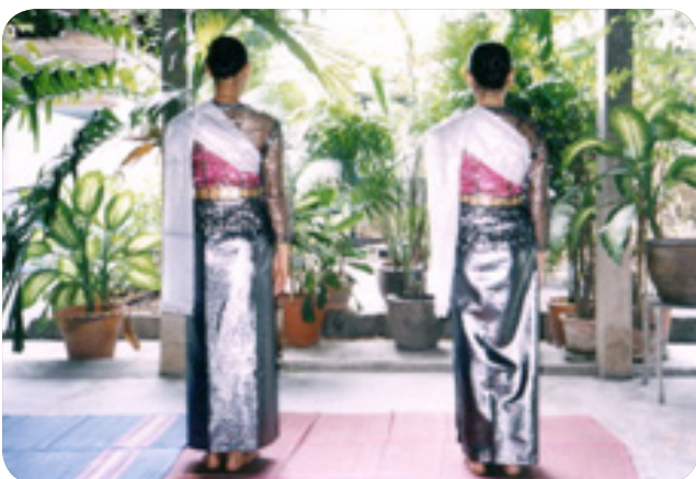
ภาพที่ 1 ภาพการแต่งกายของชุดรำมอญ คณะ ครูมงคล พงษ์เจริญ