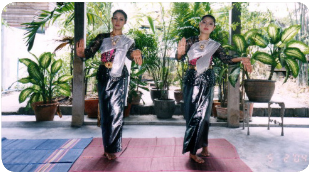
ภาพที่ 11 ท่าที่ 9 ท่าผาลา