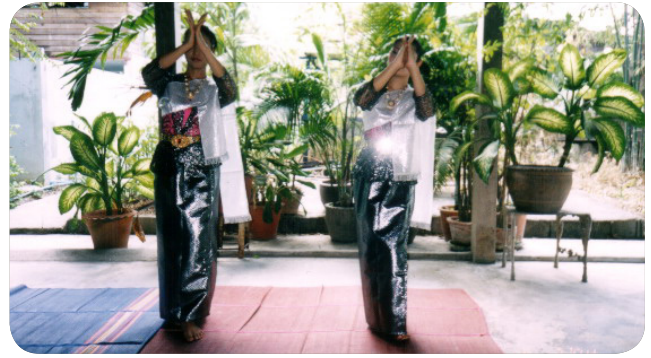
ภาพที่ 6 ท่าไหว้