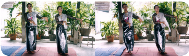
ภาพที่ 4 จิบสะบัดด้านข้างซ้าย ที่มา: รจนา สุนทรานนท์, 2547 : 23.