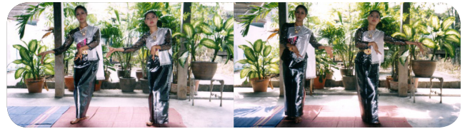
ภาพที่ 7 ท่าชานางนอนจิบคว้ามือซ้าย และ ท่าชานางนอนจิบคว้ามือขวา