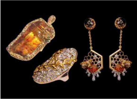
ภาพที่ 4 ต้นแบบเครื่องประดับหินดิบ

เครื่องประดับหินดิบ โดยเก็บข้อมูลจากผู้บริโภค จำนวน 100 คน พบว่า ผู้บริโภคมีความพึงพอใจต่อต้นแบบเครื่องประดับหินดิบโดยมีคะแนนเฉลี่ย 4.51 มีระดับความพึงพอใจอยู่ในระดับพึงพอใจมากที่สุด