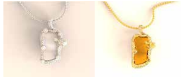
ภาพที่ 2 แบบเครื่องประดับสามมิติ แบบที่ 2

พัฒนาแบบโดยให้สามารถปรับใช้งานได้หลายรูปแบบ คือ ต่างหูสามารถใส่ได้ 2 แบบ ทั้งแบบสั้นและแบบยาว