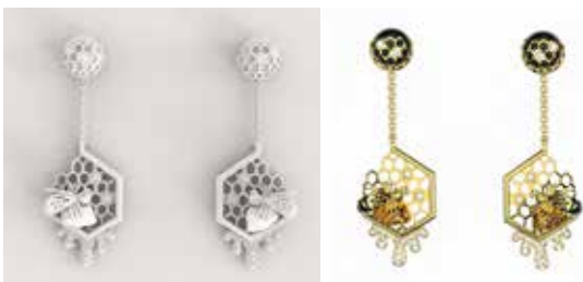
ภาพที่ 1 แบบเครื่องประดับสามมิติ แบบที่ 1

ผู้วิจัยได้นำข้อมูลที่ได้จากการวิเคราะห์แนวโน้มการออกแบบเครื่องประดับในปี 2017-2018 ทั้ง 8 แนวคิด ร่วมกับข้อมูลด้านรูปแบบและลวดลายที่แบ่งได้ 4 กลุ่ม มาผสมผสานกันและใช้เป็นแนวคิดหลักในการออกแบบเครื่องประดับหินดิบบนสำหรับศตวรรษ 21 ดำเนินการออกแบบเครื่องประดับ จำนวน 70 แบบร่าง โดยนำเอาข้อมูลวิเคราะห์ข้างต้น มาใช้เป็นแนวคิดหลักในการออกแบบเครื่องประดับ และออกแบบตามกระบวนการออกแบบทำการประเมินและคัดเลือกแบบร่าง โดยผู้เชี่ยวชาญด้านการออกแบบเครื่องประดับ จำนวน 3 ท่าน โดยใช้แบบประเมินแบบร่างเพื่อคัดเลือกแบบร่าง โดยคัดเลือกแบบร่างที่มีคะแนนสูงสุด 5 อันดับแรก นำมาพัฒนาแบบร่างตามคำแนะนำของผู้เชี่ยวชาญ ผู้วิจัยทำการเลือกจำนวน 3 แบบร่าง เพื่อผลิตชิ้นงานต้นแบบ