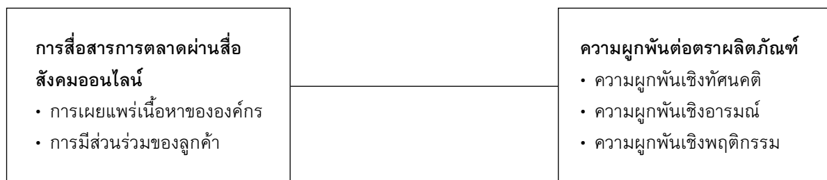
ภาพที่ 1 กรอบแนวคิดการวิจัย