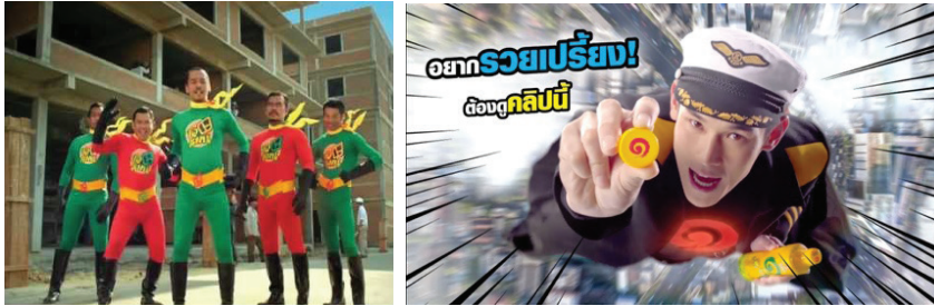
ภาพที่ 3 ตัวอย่างซูเปอร์ฮีโร่ไทยในงานโฆษณา บั๊แมน (ซ้าย) และกัณฑ์แมน (ขวา)

พิเศษที่เป็นเหตุเป็นผล ด้วยเหตุนี้งานโฆษณาโดยมากจึงไม่สามารถถูกนำมาศึกษาได้ในวิจัยชิ้นนี้ เพราะงานโฆษณานั้นมักจะใช้ซูเปอร์ฮีโร่ในเพียงแค่รูปลักษณ์เพียงเท่านั้น หากแต่ไม่มีเหตุและผลของพลังที่สอดคล้องและไม่มีเรื่องราวเกี่ยวกับการผจญภัยเข้ามาเกี่ยวข้อง ดังเช่น บั๊แมน และกัณฑ์แมน ซึ่งไม่ได้รับการออกแบบอะไรเกี่ยวกับการออกแบบพื้นฐานตัวละคร