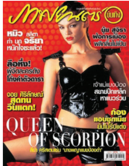
ภาพที่ 2 ตัวละครนางพญาแมงป่องดำที่ได้ขึ้นปก

ในโรงภาพยนตร์เป็นอย่างมาก และราคาจัดจำหน่ายที่อยู่ในระดับไม่แพง จนสามารถเข้าถึงผู้บริโภคได้ทุกระดับ ตัวอย่างเช่น เรื่องนางพญาแมงป่องดำ (Scorpion Warrior) ซึ่งประสบความสำเร็จอย่างมากในช่วงปี พ.ศ. 2547 จนมีการสร้างภาคต่อออกมาอีกถึง 3 ภาคด้วยกัน