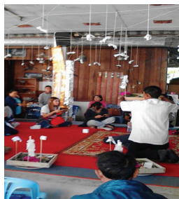
ภาพที่ 2 สะตวง (กระทรง) ในพิธีสงเคราะห์