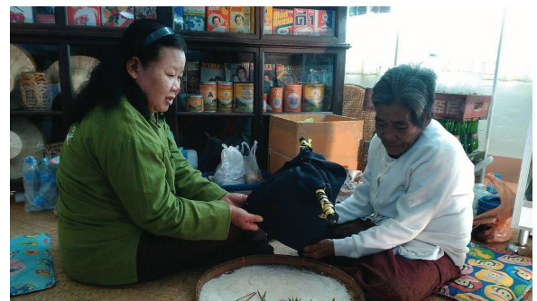
ภาพที่ 1 ผีหม้อหนึ่ง

ผีหม้อหนึ่ง ผีปากวัก ตั้งไข่ (ปักปัก) เสี่ยงรูป (ตั้งขันตั้งแล้วกำรูปหว่านลงไปบนพื้นแล้วนับดูว่าเป็นเลขคู่หรือเลขคี่) เบี้ยหยาย - เบี้ยคว่ำ จับสลากข้าว (ข่มข้าวเปลือกขึ้นมาแล้วสาดลงไปบนพื้นและนับเม็ดข้าวดูว่าได้เลขคู่หรือเลขคี่) การลงผีหม้อหนึ่ง จะใช้ขันตั้งเพียง 24 บาท ดอกไม้ รูปเทียนอีก 24 ชุดใส่ลงไปในกระดิ่งซึ่งบรรจุข้าวสาร หลังจากที่ถูกนำพิธีได้จุดรูปเทียนเพื่อเรียกวิญญาณของปู่ย่า ตายาย ซึ่งเป็นผีที่จะต้องเข้ามาสิงในหม้อหนึ่งแล้ว ชาวบ้านที่เข้าร่วมพิธีก็จะถามไถ่ถึงเหตุการณ์ที่เกิดขึ้น เช่น สาเหตุที่ตนเองมีอาการเจ็บไข้ได้ป่วยเนื่องจากอะไร หลังจากนั้นปู่ย่าตายายก็จะตอบโดยการใช้นิ้วหม้อหนึ่งขีดเขียนลงไปบนกระดิ่งซึ่งมีข้าวสารเป็นรูปต่าง ๆ เมื่อชาวบ้านทราบถึงสาเหตุแล้วก็จะกลับไปแก้ไขตามที่ผีหม้อหนึ่งบอกไว้สำหรับการแก้ไขนั้นผู้นำพิธีจะให้สัมป่อยเอาไปแช่น้ำให้คนป่วยอาบ บางคนเมื่อแก้ไขแล้วอาการป่วยดีขึ้นก็จะกลับมาตอบแทน