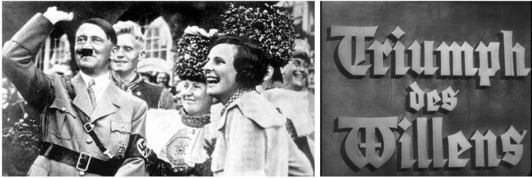
ภาพที่ 3 : Hitler ถ่ายคู่กับ Leni Riefenstahl (คนขวาสุด) ผู้กำกับภาพยนตร์ Triumph of the Will (1935)