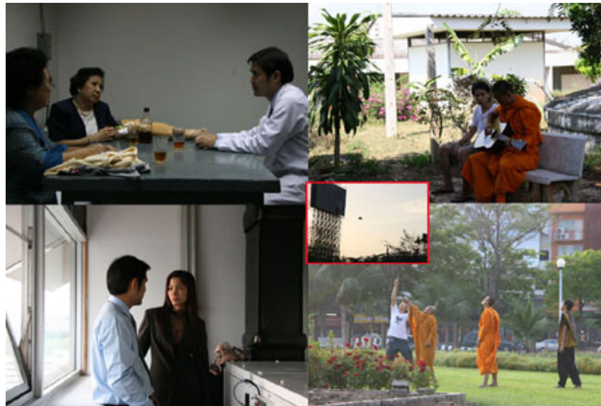
ภาพที่ 7 : ฉากในภาพยนตร์แสงศตวรรษที่ไม่ผ่านการพิจารณาจากกองเซ็นเซอร์ ที่มา : ภาพยนตร์ แสงศตวรรษ (2549) โดยอภิชาติพงศ์ วีระเศรษฐกุล

ภาพยนตร์) หรือ พระที่ตกกลางคืนก็เปลี่ยนชุดมานั่งอยู่ตามร้านข้าวต้ม ร้องคาราโอเกะ ดังที่ปรากฏในงานภาพยนตร์เพื่อศิลปะของผู้กำกับที่คิดต่างอย่างอภิชาติพงศ์ วีระเศรษฐกุล ทั้งๆที่ตัวภาพยนตร์เอง ได้รับรางวัลลำดับภาพยอดเยี่ยม จากงานเอเชียน फिल्मส์ อวอร์ดส์ ที่ฮ่องกงและรางวัลภาพยนตร์ยอดเยี่ยม Lotus du Meuilleur Film-Grand Prix ในงานเทศกาลภาพยนตร์เอเซียโตวิลล์ ครั้งที่ 9 ประเทศฝรั่งเศส