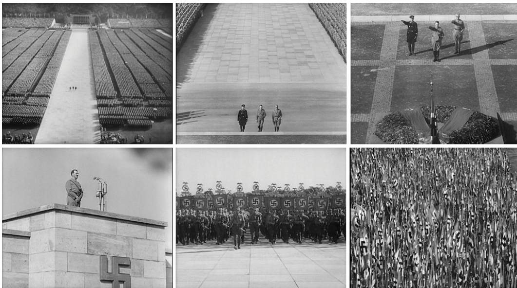
ภาพที่ 4 : ความยิ่งใหญ่ของจักรวรรดิไรช์ที่สามของพรรคนาซี เยอรมัน ในภาพยนตร์ Triumph of the Will (1935) ที่มา : https://unaffiliatedcritic.com/2017/02/triumph-of-the-will-1935/

ในประเทศสหรัฐอเมริกาเอง ก็มีการผลิตภาพยนตร์แนวโฆษณาชวนเชื่ออย่างแพร่หลาย เช่นเดียวกัน ในทศวรรษที่ 40 มักมีภาพยนตร์ที่เกี่ยวกับสงครามผลิตออกมาเพื่อสร้างแนวคิด ชาตินิยม และสร้างความรู้สึกในการเสียสละชีพของทหารหาญ เพื่อที่จะเอาชนะศัตรูของประเทศ ยกตัวอย่างเช่น Mrs. Miniver (1942) ของ William Wyler, The Battle of Midway (1942) ของ John Ford และ สารคดีชุด Why We Fight (1942-1945) ของ Frank Capra ผลลัพธ์ที่ได้ ก็คือ มีชายหนุ่มมาสมัครเป็นทหารเป็นจำนวนเพิ่มขึ้นมาก