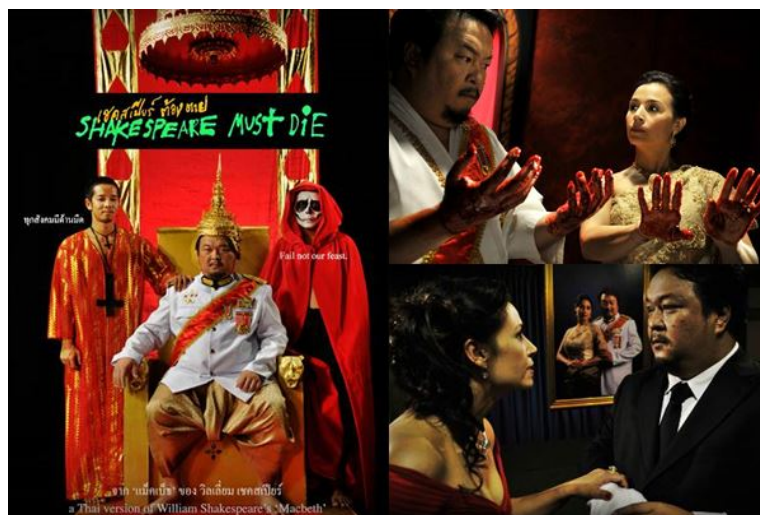
ภาพที่ 9 : จากภาพยนตร์เซกสเปียร์ต้องตาย (2555) ภาพยนตร์ที่ถูกห้ามฉายในประเทศไทย

เซ็นเซอร์) กรมส่งเสริมวัฒนธรรม กระทรวงวัฒนธรรม ในสมัยรัฐบาลนางยิ่งลักษณ์ ชินวัตร เมื่อวันที่ 3 เมษายน พ.ศ. 2555 ได้รับเรต "ท" หรือ ห้ามเผยแพร่ในประเทศไทย โดยให้เหตุผลว่ามีเนื้อหาที่ก่อให้เกิดการแตกความสามัคคีระหว่างคนในชาติ ทั้งนี้เนื่องจากในภาพยนตร์มีการอ้างอิงถึงเหตุการณ์ 6 ตุลาคม พ.ศ. 2519 มีการนำชุดทิวภาพความเสียหายจากเหตุการณ์ความไม่สงบทางการเมืองในประเทศไทย เมษายน พ.ศ. 2552 มาใช้และการให้ปีศาจในเรื่องสวมชุดสีแดงเปรียบเหมือนเหมือนการกล่าวหาเสื้อแดง กล่าวคือ คณะกรรมการฯ มองว่าภาพยนตร์เรื่องนี้สะท้อนความจริงของสังคมไทยเกินไป จนอาจเป็นภัยคุกคามความมั่นคงของประเทศ