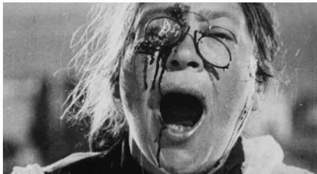
ภาพที่ 2 : Montage จากภาพยนตร์เรื่อง The Battleship Potemkin (1925)