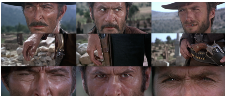
ภาพที่ 1 : Montage ฉากดวลปืนจากภาพยนตร์ The Good, the Bad and the Ugly (1966)

Quentin Tarantino ผู้กำกับชื่อดังผู้สร้างภาพยนตร์อย่าง Pulp Fiction (1994), Kill Bill (2003) และ Inglorious Basterds (2009) เคยให้สัมภาษณ์ไว้ในรายการโทรทัศน์ของ Charlie Rose ถึงพลังของภาพยนตร์ไว้ว่า “สิ่งหนึ่งที่ทำให้ผมหลงใหลในภาพยนตร์ มันทำให้ผมรู้สึกว่ามันเป็นรูปแบบของงานศิลปะที่ผมชื่นชอบมากที่สุด ก็คือ เมื่อคุณเข้าไปดูภาพยนตร์ ได้เห็นบางฉากบางตอนในหนึ่งทีที่แสดงถึงพลังของภาพยนตร์ ที่ถ่ายทอดโดยผู้กำกับพวกประเภทที่เราเชื่อว่า พระเจ้าให้เกิดมาทำหน้าที่โดยเฉพาะเหล่านั้น ในฉากนั้นๆมันมีทั้งส่วนผสมของการตัดต่อ เสียง และภาพ ซึ่งผสมผสานกันได้อย่างลงตัว เหมาะเจาะพอดีสุดๆ ตัวอย่างเช่น Montage ฉากดวลปืนตอนท้ายเรื่องของหนัง The Good, the Bad and the Ugly (1966) ซึ่งเป็นฉากที่ผม ไม่มีทางที่จินตนาการว่าตัวเองจะคิดอะไรแบบนี้ได้ มันเหมือนกับทำให้คุณลึ้มหายใจกันไปเลยทีเดียว เหมือนคุณได้หายใจตัวไปอยู่ในอีกโลกหนึ่ง งานศิลปะอื่นอย่าง ดนตรีนวนิยาย หรือ ภาพเขียน แม้มันจะมีวิธีสื่อที่ให้ความรู้สึกพิเศษในแบบของมันเองก็ตาม แต่เพียงตัวศาสตร์เดียวลำพัง ก็ไม่สามารถทำให้คุณได้รับความรู้สึก หรือมีประสบการณ์อย่างที่ภาพยนตร์ให้เช่นนี้ได้ โดยเฉพาะอย่างยิ่ง ในโรงภาพยนตร์ที่คุณสามารถแบ่งปันประสบการณ์นี้ร่วมกับคนภายในโรงภาพยนตร์เดียวกัน ณ ขณะนั้น เป็นความรู้สึกที่ตื่นเต้นและอึดอึด เกินคำบรรยายจริงๆ” 2