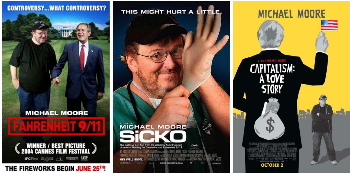
ภาพที่ 5 : โปสเตอร์ภาพยนตร์ต่างๆ ของ Michael Moore ที่มักจะมีตัวของเขাপრაกฏอยู่ด้วยเสมอ

ร่วมในการเลือกตั้งมากขึ้น โดยเป็นกลุ่มที่มีบทบาทสำคัญในการเลือกตั้งประธานาธิบดีสหรัฐฯครั้งที่ทำให้ นาย Barack Obama ชนะการเลือกตั้งและ Michael Moore ก็ได้กลายเป็นผู้สร้างภาพยนตร์สารคดีที่ทรงอิทธิพลมากคนหนึ่งของอเมริกาไปโดยปริยาย