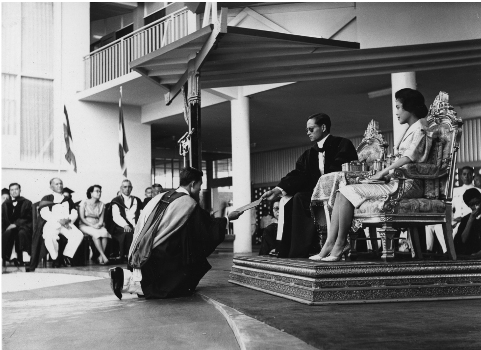
เสด็จพระราชทานปริญญาบัตร พ.ศ.2502 (ปฐมวาระ)

ระหว่างพ.ศ. 2517-2531 พระบาทสมเด็จพระปรมินทรมหาภูมิพลอดุลยเดชได้เสด็จพระราชดำเนินในการพระราชทานปริญญาบัตรแก่บัณฑิตของมหาวิทยาลัยศรีนครินทรวิโรฒ ทั้งในกรุงเทพฯ และต่างจังหวัด และพระราชทานพระบรมราชโองการที่เป็นแนวทางสำหรับการพัฒนามหาวิทยาลัยให้ยั่งยืน และพระบรมราชโองการที่นำประโยชน์เอื้อเกื้อกันต่อกันแก่บัณฑิตและศิษย์เก่าของมศวทุกวิทยาเขต ทั้งในด้านความคิดการทำงาน ตลอดจนการประพฤติปฏิบัติตน ในบทความนี้จะเน้นศึกษาพระบรมราชโองการที่จารึกอยู่ในประวัติศาสตร์สมัยเริ่มแรกของชาวมศว (พ.ศ. 2517-2531) ที่มี 8 วิทยาเขต และเป็นช่วงเวลาที่ยังมีมหาวิทยาลัยผลิตบัณฑิตทางด้านศึกษาศาสตร์เป็นหลัก พระบรมราชโองการส่วนใหญ่จึง สะท้อนถึงแนวพระราชดำริเกี่ยวกับ การพัฒนาการศึกษาและการพัฒนาคนซึ่งเป็นหัวใจของการพัฒนาประเทศให้ยั่งยืน