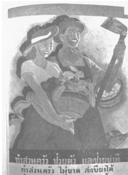
ภาพประกอบ 3 รางวัลชนะเลิศประเภทรูปส่งเสริมอาชีพเกษตรกรรม โดยนายสนิท ดิถพันธ์ุ พ.ศ. 2486

ที่ดีจากการรับประทานพืชผักที่ตนเองปลูกและเป็นการประหยัดรายจ่ายครอบครัว กับเป็นการช่วยชาติ อันหมายถึง การผลิตเสบียงอาหารให้เพียงพอต่อความต้องการของประเทศ ในยามศึกสงครามได้อีกด้วย ดังปรากฏคำขวัญได้ภาพว่า “ทำสวนครัว ช่วยตัวและช่วยชาติ”