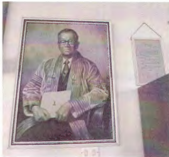
ห้อง ศ.ขจร สุขพานิช ที่ชั้น 6 สำนักหอสมุดกลาง มศว และหนังสือส่วนหนึ่ง