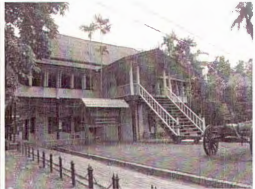
(ซ้าย) อาคารสำนักงานของบริษัทอีสต์เอเชียติกประมาณ พ.ศ. ๒๔๔๙ (ขวา) อาคารสำนักงานของบริษัทอีสต์เอเชียติก ภายหลังใช้เป็นอาคารเรียนของโรงเรียนป่าไม้ จังหวัดแพร่ ปัจจุบันใช้เป็นพิพิธภัณฑน์ไม้สัก