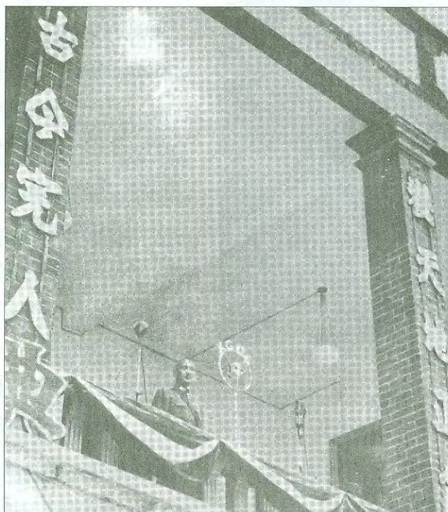
ประธานาธิบดีเจียง ไคเชค กล่าวคำปราศรัยเรียกร้องให้ชาวจีน ต่อต้านการรุกรานของญี่ปุ่น เมื่อ ค.ศ.1937