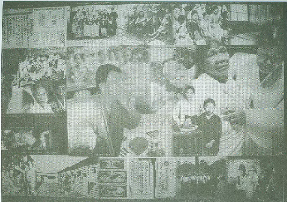
นิทรรศการต่อต้านตำราเรียนประวัติศาสตร์ของญี่ปุ่น และการทารุณกรรมของทหารญี่ปุ่นต่อเกาหลี ที่หอเอกราชของเกาหลี