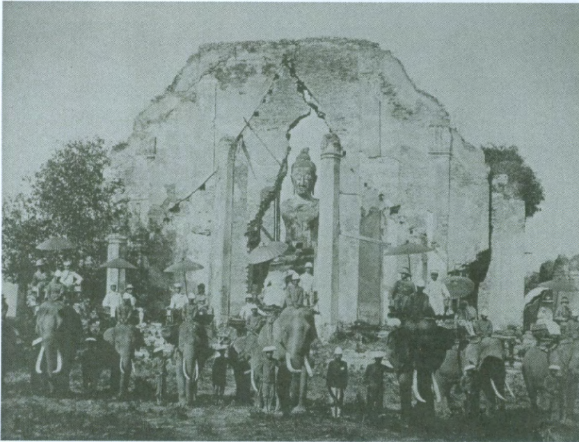
สมเด็จพระยาบรมราชานุภาพทรงฉายพระรูปร่วมกับตึกโยฮันอัลเบรคต์

ทรงโปรดฯ ให้ พระเจ้าน้องยาเธอกรมหลวงดำรงราชานุภาพ ทูลเชิญตึกโยฮันอัลเบรคต์และพระชายา ทรงช้างเสด็จประพาสเมืองโบราณที่กรุงเก่า เมื่อวันที่ ๘ กุมภาพันธ์ พ.ศ. ๒๔๕๒ ๑๐ และได้มีการฉายพระรูปร่วมกัน ดังปรากฏเป็นภาพถ่ายประวัติศาสตร์ที่บริเวณหน้าวิหารพระมงคลบพิตร ซึ่งนอกจากเป็นการตอบแทนพระราชไมตรีที่พระองค์เคยได้รับจาก ตึกโยฮันอัลเบรคต์เมื่อครั้งเสด็จเยือนยุโรปครั้งที่ ๑ แล้ว ยังเป็นการแสดงความศรัทธาในแบบฉบับของประเทศไทยสยาม ตามแบบอย่างของนานาอารยประเทศด้วย (ดังภาพประกอบ)