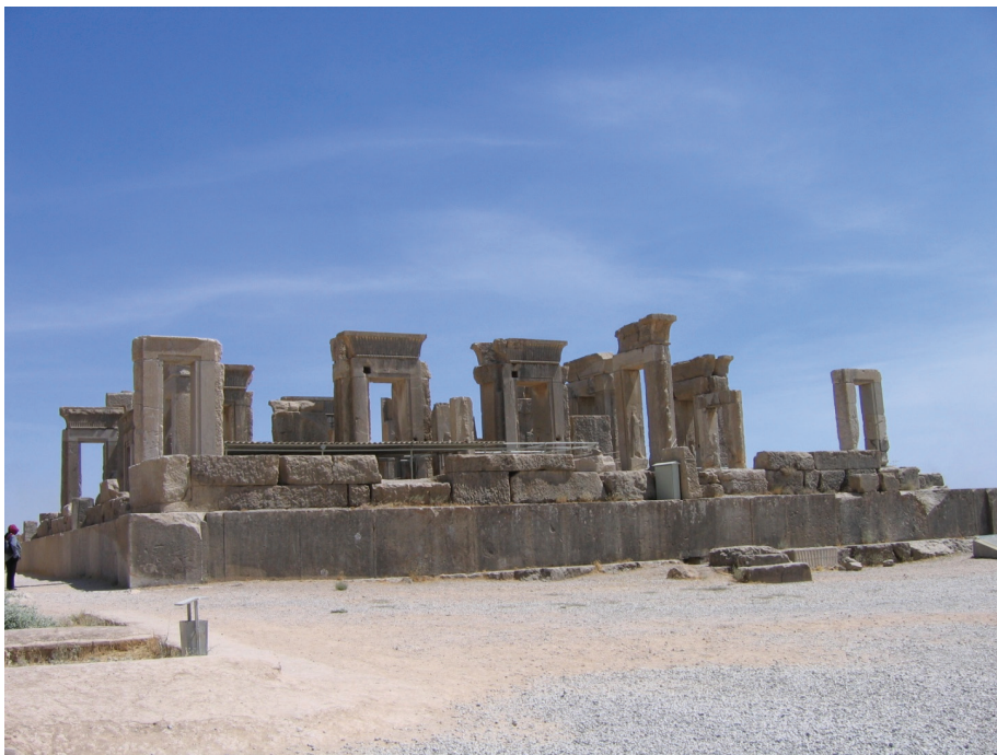
ภาพ 1 เพอร์เซโปลิส Persepolis แหล่งประวัติศาสตร์ (เมืองซีราส) (ผู้วิจัย)

ตามกฎหมายและระเบียบของแต่ละประเทศ และจะแลกเปลี่ยนผู้เชี่ยวชาญ หลักสูตร และนักการศึกษา ด้านการท่องเที่ยว รวมทั้งจะร่วมมือและช่วยเหลือซึ่งกันและกันในการฝึกอบรมบุคลากรด้านการท่องเที่ยว ตลอดจนส่งเสริมการแลกเปลี่ยนคณะด้านการท่องเที่ยวทั้งภาครัฐและภาคเอกชน ดังนั้นอิหร่านและไทย จึงมีปัจจัยพื้นฐานที่เกื้อหนุนให้ทั้งสองประเทศสามารถดำเนินความร่วมมือด้านการท่องเที่ยวให้เกิดผลอย่างเป็นรูปธรรม ในการนี้ไทยและอิหร่านพึงนำจุดแข็งที่แต่ละประเทศมีอยู่ มาดำเนินการร่วมกัน เพื่อนำมาซึ่งการท่องเที่ยวเชิงคุณภาพ ซึ่งจุดแข็งของอิหร่านได้แก่ การเป็นหนึ่งในประเทศที่เป็นอู่อารยธรรม ของโลกโดยอารยธรรมของอิหร่านมีอายุเก่าแก่ถึง 7,000 ปี และมีสถานที่ท่องเที่ยวที่ได้รับการยกย่อง ให้เป็นมรดกโลกอยู่มากมายหลายแห่ง อย่างไรก็ตาม อิหร่านยังจำเป็นต้องพัฒนาโครงสร้างพื้นฐาน เพื่อให้สามารถรองรับตลาดท่องเที่ยวที่มีศักยภาพที่จะเติบโตได้อีกมาก