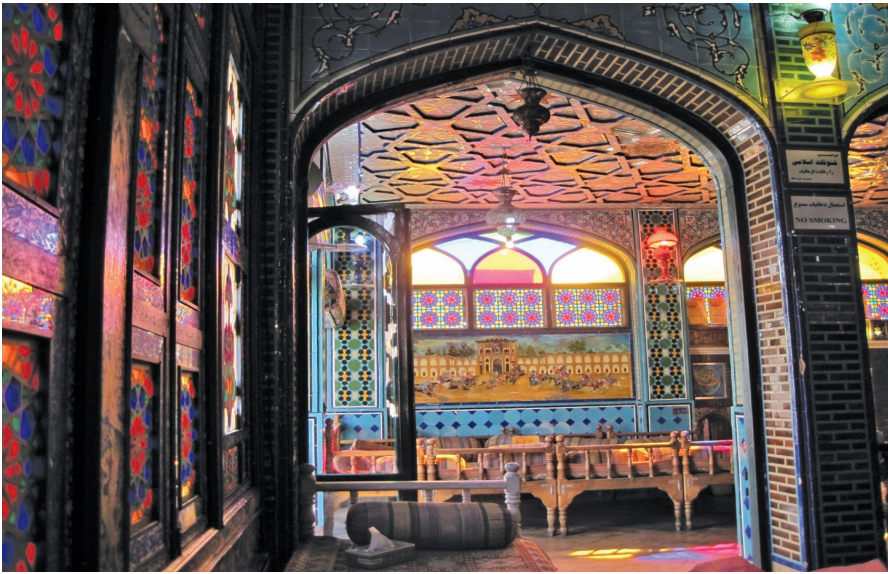
ภาพ 2 ร้านอาหารในเมืองอิสฟาฮาน (เมืองท่องเที่ยวที่สำคัญของอิหร่าน)