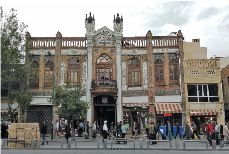
ภาพ 3 ย่านตลาดกลางค้าในกรุงเตหะราน

ในขณะเดียวกัน ประเทศไทยมีจุดแข็งด้านประสบการณ์การพัฒนาโครงสร้างพื้นฐานสำหรับการท่องเที่ยว ไม่ว่าจะเป็นความสามารถในด้านการประชาสัมพันธ์การท่องเที่ยว ความสามารถในการบริหารจัดการโรงแรม/ที่พักและอุตสาหกรรมภาคบริการสำหรับนักท่องเที่ยว การมีแหล่งท่องเที่ยวทางธรรมชาติสำหรับครอบครัวและแหล่งช้อปปิ้งมากมาย การมีครัววีลแชร์ที่ไม่เป็นที่สองรองใคร การมีความเชี่ยวชาญด้านการแพทย์และการให้บริการที่ยอดเยียม รวมทั้งยังมีศักยภาพด้านธุรกิจการบินที่กำลังเติบโตอย่างมาก