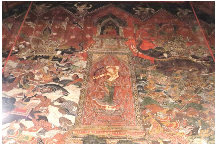
ภาพ 17 ภาพมารผจญ ผนังเบื้องหน้าพระประธาน ณ พระอุโบสถวัดสุวรรณาราม ที่มาภาพ: ผู้วิจัย ถ่ายเมื่อวันที่ 6 เมษายน 2564