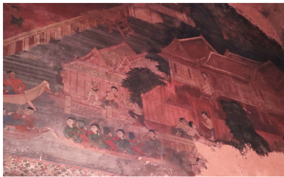
ภาพ 30 ภาพการลักพาเด็กที่ใส่เครื่องประดับมีค่า ผนังด้านหน้าพระประธาน พระอุโบสถ วัดกัลยาณมิตร ที่มาภาพ: ผู้วิจัย ถ่ายเมื่อวันที่ 6 เมษายน 2564

“...เมืองไทยมีธรรมเนียมไม่ดีมาแต่โบราณอาภัพกว่าเมืองอื่นๆ ทุกบ้านทุกเมืองอยู่อย่างหนึ่ง เมืองอื่นๆ เขาถึงจะมีเงินทองเขาก็เก็บไว้เอง แลประกอบการค้าขายไปตามธรรมเนียม หรือถึงจะตกแดงเข้าในตัว เขาก็แดงเข้าในตัวผู้ใหญ่...ฝ่ายเด็กๆ นั้นเขาไม่เอาอะไรไว้ เขาตกแดงให้แต่เสื้อกางเกง จึงไม่มีเหตุที่จะมีผู้ร้ายจับเอาเด็กไปฆ่าเสีย ก็ฝ่ายชาวเมืองไทยนี้ เมื่อเงินทองมีขึ้นไม่ได้ พอใจอยากอวดเขาว่ามั่งมี อวดอวดไม่ได้ ทำกำไลกำนบิวสอดสวมให้ลูกเล็กๆ ข้างละสิบบาทบ้าง สามตำลึงบ้าง แล้วทำกำไลเท้า ให้ข้างละสามตำลึงสี่ตำลึง แล้วปล่อยให้เด็กไปเที่ยววิ่งอยู่หน้าบ้านหน้าเรือนกลางถนน ลงอาบน้ำในแม่น้ำ ลำคลองกลางวันกลางคืน แลไวใจแก่ทาสที่เป็นคนมีทุกซี่ยาก ซึ่งเป็นคนไม่ควรจะวางใจให้เลี้ยงดูแลพาไปข้างโน้นข้างนี้ เหมือนหนึ่งเอาปลาอย่างไปมอบส่งให้แก่แมวไว้...ด้วยความประมาททั้งกลางวันกลางคืน ก็เกิดเหตุคือทาสในเรือนที่เลี้ยงบุตรนั่นเอง พาบุตรนั้นไปปีบคอกจมน้ำทำให้ตายเสีย...” 1