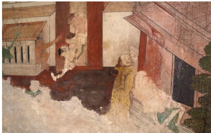
ภาพ 20 ชาวตะวันตกยืนอยู่บริเวณมุข ผันเรื่องจันทกุมารชาดก ณ พระอุโบสถ วัดสุวรรณาราม ถ่ายเมื่อวันที่ 6 เมษายน 2564