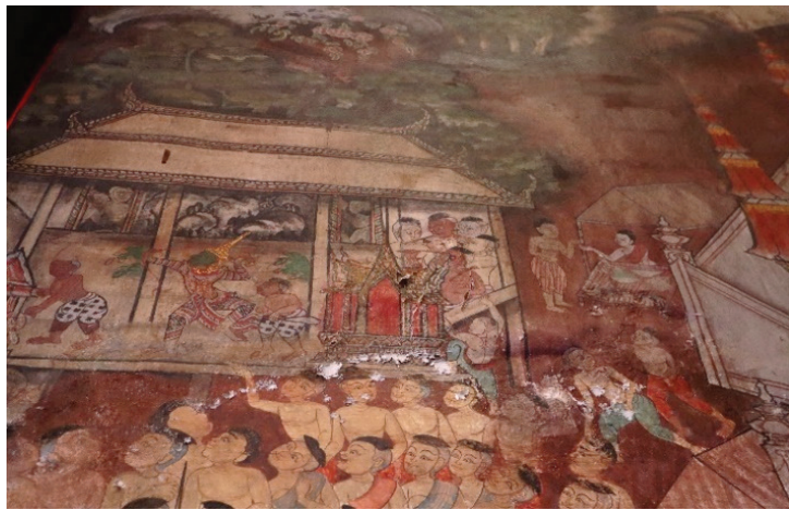
ภาพ 28 ชุดภาพชมมหรสพ: การแสดงโขน ผนังด้านข้างของพระอุโบสถ วัดทองธรรมชาติ ถ่ายเมื่อวันที่ 6 เมษายน 2564