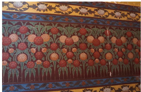
ภาพ 5 จิตรกรรมลายดอกเบญจมาศแบบจีน พระวิหารหลวง วัดกัลยาณมิตร ถ่ายเมื่อวันที่ 6 เมษายน 2564