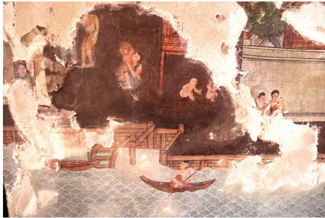
ภาพ 34 ภาพขำรูด: ภาพวิถีชีวิตผู้คนบริเวณท่าหน้า ผ้างด้านหลังพระประธาน ณ พระอุโบสถ วัดทองธรรมชาติ ที่มาภาพ: ผู้วิจัย ถ่ายเมื่อวันที่ 6 เมษายน 2564

ปัญหาในการสำรวจลงพื้นที่วิจัยพบว่า ภาพจิตรกรรมหลายภาพได้ขำรูดเสียหายจากความชื้นที่เกิดขึ้น เนื่องจากวัดทองธรรมชาติ วัดกัลยาณมิตร และวัดสุวรรณาราม เป็นวัดที่ตั้งอยู่ริมน้ำทั้งสามแห่ง เมื่อเกิดสภาวะน้ำท่วมในระดับสูง จะได้รับผลกระทบมากโดยเฉพาะเหตุการณ์น้ำท่วมใน พ.ศ.2554 ทำให้ภาพจิตรกรรมบริเวณผนังใหญ่ด้านหลังพระประธาน พระอุโบสถ วัดทองธรรมชาติ ซึ่งเป็นภาพบอกเล่าสภาพบ้านเรือนและวิถีชีวิตผู้คนในสมัยรัชกาลที่ 3 ได้รับความเสียหาย ผนังได้หลุดร่อนเป็นแนวยาวตามระดับน้ำที่ท่วมเข้าบริเวณพระอุโบสถ ในขณะที่ภาพจิตรกรรมเล่าเหตุการณ์นักโทษพม่าขโมยของจากเรือแม่ค้าและคตัสักพาเด็ก พระอุโบสถ วัดกัลยาณมิตร อยู่ในบริเวณผนังด้านบนก็ได้รับผลกระทบจากความชื้นสูงเช่นกัน ภาพจิตรกรรมเล่าเรื่องสังคัมและวิถีชีวิตชุมชนสมัยรัชกาลที่ 3 ยังปรากฏอยู่ตามวัดสำคัญในบริเวณฝั่งธนบุรีอีกหลายแห่ง ส่วนใหญ่ที่ตั้งวัดอยู่ตามริมสองฝั่งแม่น้ำเจ้าพระยาและหันบริเวณด้านหน้าออกแม่น้ำ ซึ่งในอดีตใช้เป็นการสัญจรคมนาคมทางน้ำเป็นหลัก ก็จะได้รับผลกระทบในเรื่องของความชื้นต่อภาพจิตรกรรมในลักษณะเดียวกัน ภาพจิตรกรรมเหล่านี้เป็นหลักฐานที่มีคุณค่าทั้งทางมรดกภูมิปัญญาฝีมือช่างในสมัยรัตนโกสินทร์ตอนต้น และเป็นหลักฐานเล่าเรื่อง สะท้อนสังคัมและวิถีชีวิตผู้คนในสมัยรัชกาลที่ 3 ที่มีความจำเป็นอย่างยิ่งในการได้รับการบูรณะซ่อมแซมจากหน่วยงานที่เกี่ยวข้อง เพื่อให้ภาพเล่าเรื่องมีความสมบูรณ์โดยเนื้อหาและมีความงามทางศิลปะสืบต่อไป