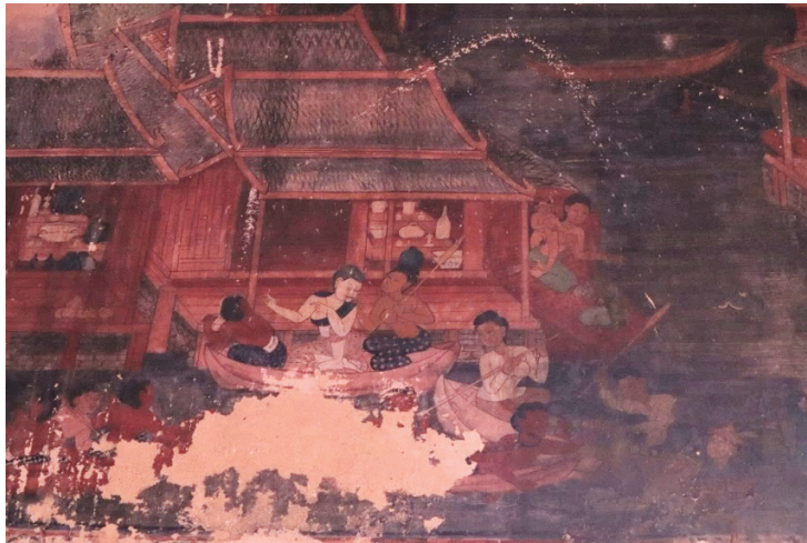
ภาพ 29 ภาพแม่ค้าพายเรือขายผลไม้กำลังถูกนักโทษพม่าขโมยผลไม้ในเรือ ผนังด้านหน้าพระประธาน พระอุโบสถ วัดกัลยาณมิตร