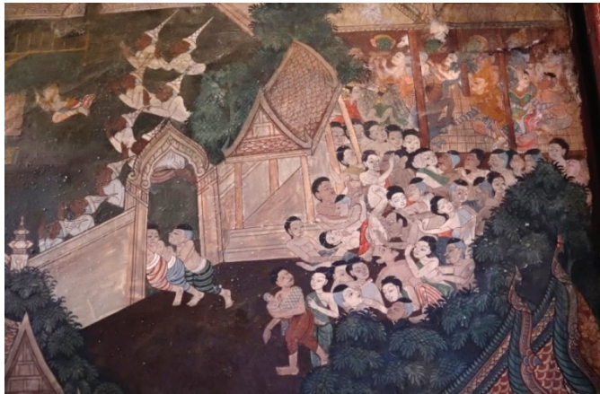
ภาพ 25 ชุดภาพชมมหรสพ: ผู้คนมาชมมหรสพละครนอกกันแน่นขนัด มองเห็นกลุ่มขุนนางสวมลอมพอก ผนังด้านข้าง ณ พระอุโบสถ วัดทองธรรมชาติ ที่มาภาพ: ผู้วิจัย ถ่ายเมื่อวันที่ 6 เมษายน 2564