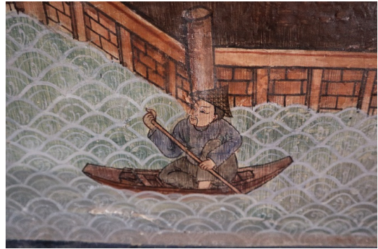
ภาพ 14 ชายชาวจีนสวมหมวกแหลมแบบจีน กำลังพายเรือ ณ พระอุโบสถ วัดทองธรรมชาติ ถ่ายเมื่อวันที่ 6 เมษายน 2564