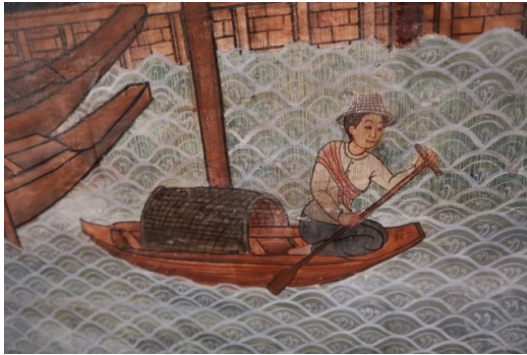
ภาพ 13 สตรีชาวบ้านสวมงอบกำลังพายเรือ ณ พระอุโบสถ วัดทองธรรมชาติ ถ่ายเมื่อวันที่ 6 เมษายน 2564