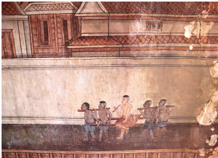
ภาพ 12 บ่าวไพร่แบกเสลี่ยงให้เจ้านายนั่ง ณ พระอุโบสถ วัดทองธรรมชาติ ที่มาภาพ: ผู้วิจัย ถ่ายเมื่อวันที่ 6 เมษายน 2564