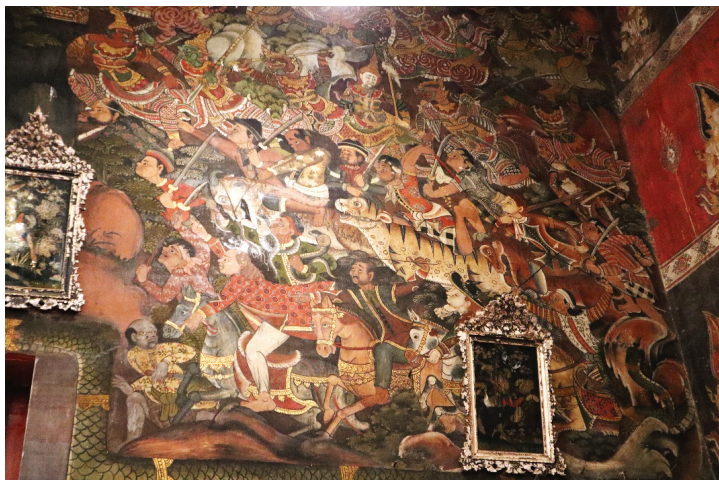
ภาพ 18 ภาพมารผจญหลายหลายเชื้อชาติในทัพมารของพญาวัสวดีมาร มีทั้งจีน ฝรั่งเศส แจก จาม ณ พระอุโบสถ วัดสุวรรณาราม ที่มาภาพ: ผู้วิจัย ถ่ายเมื่อวันที่ 6 เมษายน 2564

ภาพกลุ่มชาวต่างชาติยังปรากฏแทรกอยู่ในเนื้อหาทศชาติตอนต่างๆ ของจิตรกรรมภายในพระอุโบสถวัดสุวรรณาราม ตัวอย่างเช่น เรื่องมโหสถชาดก ฝีมือช่างครูคงแป๊ะหรือหลวงเสนีย์บริรักษ์ จิตรกรฝีมือชั้นครูในสมัยรัชกาลที่ 3 ได้วาดประชันกับครูทองอยู่หรือหลวงวิจิตรเจษฎาซึ่งวาดเรื่องเนมิราชชาดก ครูคงแป๊ะได้วาดกลุ่มทหารชาวต่างชาติทั้งกลุ่มแขกและกลุ่มฝรั่งในเนื้อหาเรื่องมโหสถชาดกอย่างน่าสนใจ มีทหารเป็นแขกเปอร์เซียเป็นแขกชาวโพกผ้าบริเวณศีระะ เหนือขึ้นไปบนป้อมเป็นทหารแต่งกายแบบตะวันตกกำลังถืออาวุธปืน ในขณะที่ผนังเรื่องจันทกุมารชาดก จิตรกรที่วาดได้สอดแทรกวิถีชีวิตผู้คนตามเนื้อเรื่องให้มีชาวตะวันตกยืนอยู่มุมหนึ่ง