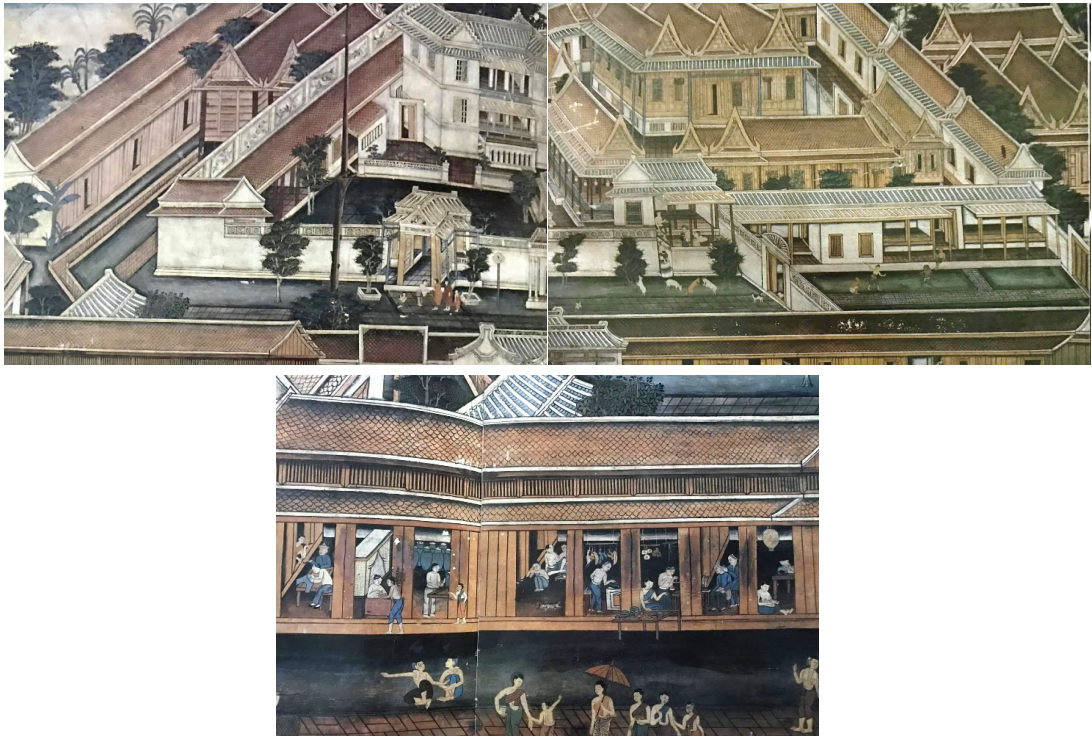
ภาพ 8 ภาพเรือนไทยสามหลังแฝดอยู่ติดกับบ้านตึกแบบจีน ด้านหน้าเป็นร้านค้า ผนังด้านหลังพระประธาน ณ พระอุโบสถ วัดทองธรรมชาติ