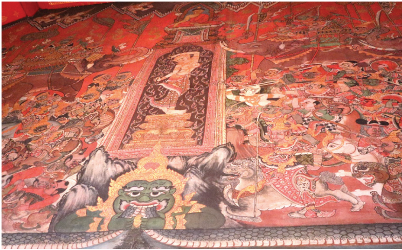
ภาพ 15 ภาพมารผจญแบบสิบสองภาษา มีทหารชาวจีน ชาวตะวันตกในทัพมาร ณ พระอุโบสถ วัดทองธรรมชาติ ที่มาภาพ: ผู้วิจัย ถ่ายเมื่อวันที่ 6 เมษายน 2564