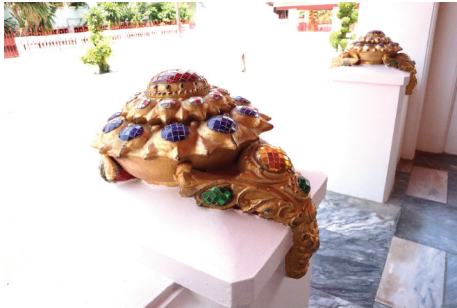
ภาพ 32 ปูนปั้นประดับเป็นรูปอำมรงค์บริเวณทางเข้าพระอุโบสถ วัดทองธรรมชาติ