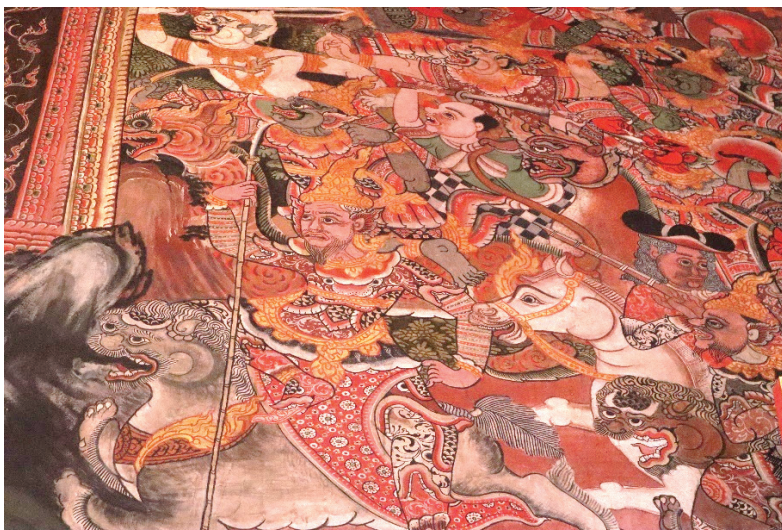
ภาพ 16 ภาพทหารชาวจีนในทัพมารแต่งกายคล้ายจิ้งจอก ณ พระอุโบสถ วัดทองธรรมชาติ ถ่ายเมื่อวันที่ 6 เมษายน 2564