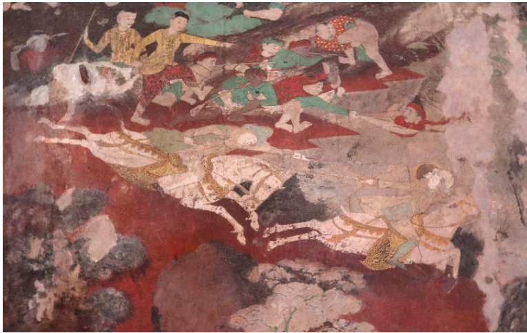
ภาพ 21 ทหารตะวันตกขี่ม้า ผนังเรื่องมโหสถชาดก ณ พระอุโบสถ วัดสุวรณาราม ที่มาภาพ: ผู้วิจัย ถ่ายเมื่อวันที่ 6 เมษายน 2564