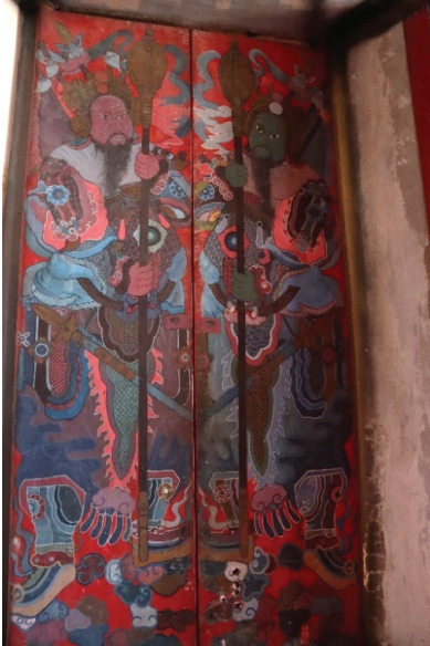
ภาพ 6 ภาพทวารบาลแบบจีนหรือเขี้ยวกาง พระอุโบสถ วัดกัลยาณมิตร

นอกจากการตกแต่งลวดลายดอกไม้ในส่วนต่างๆ ของงานจิตรกรรมไทย มักจะพบเห็นภาพทวารบาลแบบจีน ซึ่งเป็นเทวดาจีนถืออาวุธ ในลักษณะและคติความเชื่อเทวดาถือพระขรรค์แบบไทย ภาพทวารบาลแบบจีนนี้ เรียกว่า “เขี้ยวกาง” ได้ปรากฏให้เห็นทั้งบานประตูที่วัดกัลยาณมิตรและวัดสุวรรณาราม