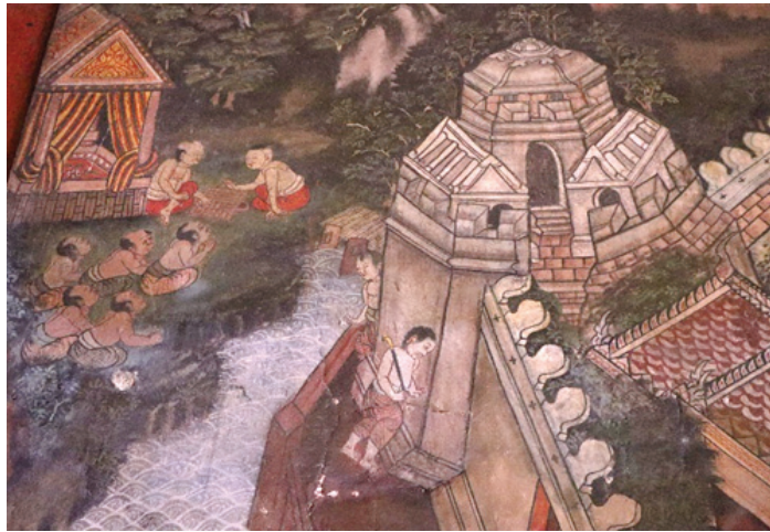
ภาพ 11 เจ้านายเล่นหมากรุก มีบ่าวไพร่หนึ่งคอยรับใช้ ณ พระอุโบสถ วัดทองธรรมชาติ ถ่ายเมื่อวันที่ 6 เมษายน 2564