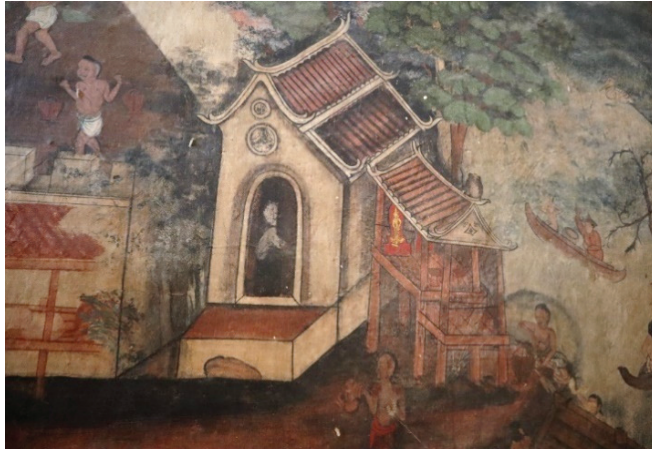
ภาพ 10 ศาลเจ้าแบบไทยและศาลเจ้าแบบจีนตั้งอยู่ติดกัน ณ พระอุโบสถ วัดสุวรรณาราม ถ่ายเมื่อวันที่ 6 เมษายน 2564