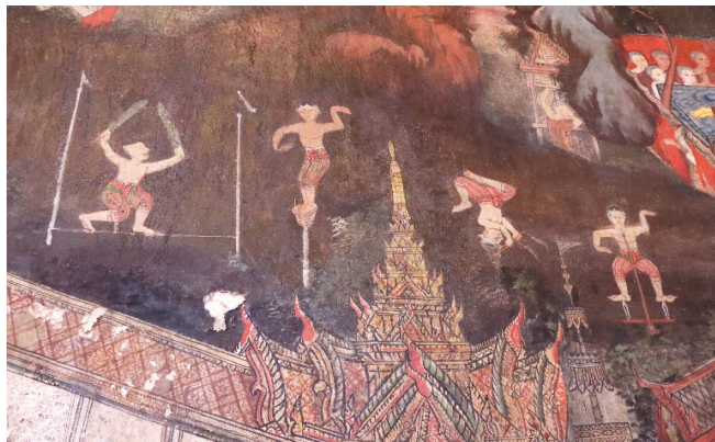
ภาพ 24 ชุดภาพชมมหรสพ: การแสดงมหรสพการเล่นญวนหก ผนังด้านข้าง ณ พระอุโบสถ วัดทองธรรมชาติ ถ่ายเมื่อวันที่ 6 เมษายน 2564

กิจกรรมบันเทิงรื่นเริงของสังคมในอดีต มีเพียงงานฉลองสมโภชการสร้างวัดวาอารามใหม่หรือ การปฏิสังขรณ์วัดเก่า จะมีการจัดงานสมโภช 7 วัน 7 คืน ซึ่งจะมีการแสดงมหรสพต่างๆ นอกจากนี้ยังมีการแสดงในงานเผาศพด้วย เรียกว่า มหรสพหน้าไฟ สันนิษฐานว่าจัดขึ้นเพื่ออบดับความเศร้าคลายความทุกข์ลง จิตรกรรมในสมัยรัชกาลที่ 3 นี้ ได้มีการวาดภาพชุดการแสดงมหรสพหน้าไฟที่ผนังด้านข้างของพระอุโบสถ วัดทองธรรมชาติ ถ่ายทอดรายละเอียดวิถีชีวิตผู้คนระหว่างการเล่นมหรสพ เช่น กลุ่มคนเบียดเสียดเข้ามาชม มีทั้งคนชรา แม่ลูกอ่อน หญิงชายปะปนกัน การเล่นที่ปรากฏได้แก่ หุ่น โขน ละครนอก งิ้ว และการเล่นญวนหกของชาวญวน (การแสดงกายกรรม มาจากหกคะเมนตีลังกา) 1