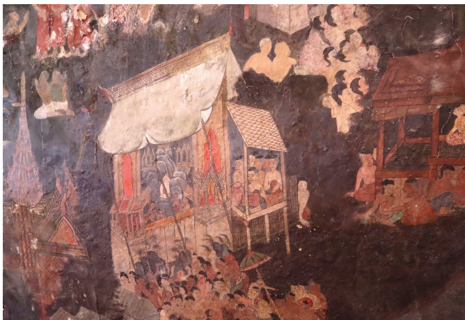
ภาพ 26 ชุดภาพชมมหรสพ: ชาวบ้านไปชมมหรสพการเล่นหุ่น ผนังด้านข้าง ณ พระอุโบสถ วัดทองธรรมชาติ ถ่ายเมื่อวันที่ 6 เมษายน 2564