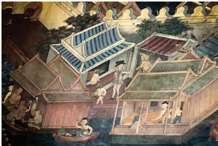
ภาพ 1 หมอบรัดเลย์และภรรยาในบริเวณโอสโตศาลา ณ วิหารหลวง วัดกัลยาณมิตร ที่มาภาพ : ชมศิลป์ผ่องธนบุรี ตูจิตรกรรมสะท้อนชีวิต. สืบค้นเมื่อ 28 พฤษภาคม 2564,