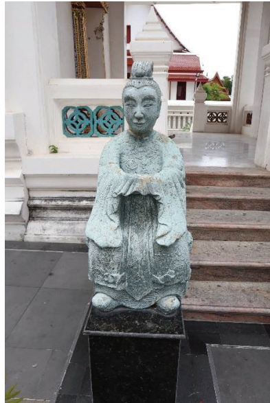
ภาพ 3 ตุ๊กตาหินหรืออับเฉาชาวจีน ข้างวิหาร วัดสุวรรณาราม ที่มาภาพ: ผู้วิจัย ถ่ายเมื่อวันที่ 6 เมษายน 2564