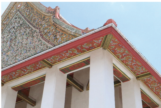
ภาพ 4 ลวดลายจิตรกรรมในส่วนเพดานของพาลี พระอุโบสถ วัดกัลยาณมิตร ที่มาภาพ: ผู้วิจัย ถ่ายเมื่อวันที่ 6 เมษายน 2564