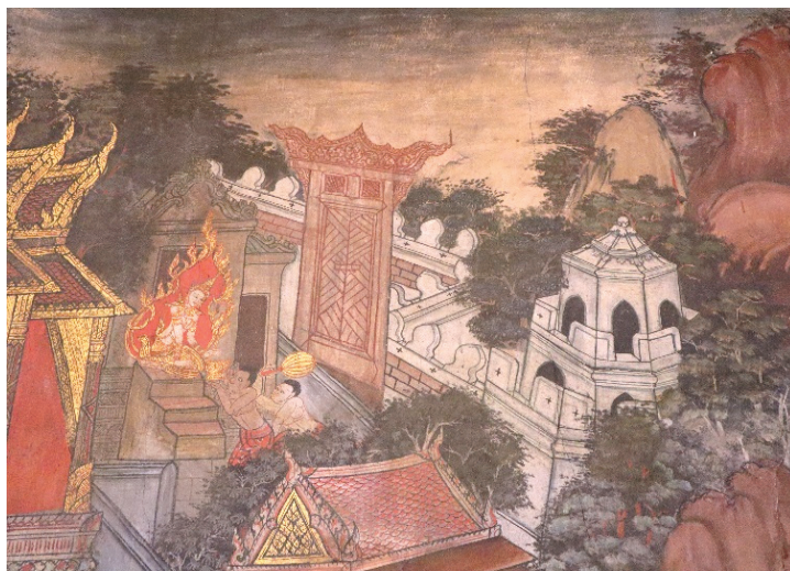
ภาพ 9 การสร้างกำแพงเมือง ชุมประตูปแบบตะวันตก ณ พระอุโบสถ วัดทองธรรมชาติ