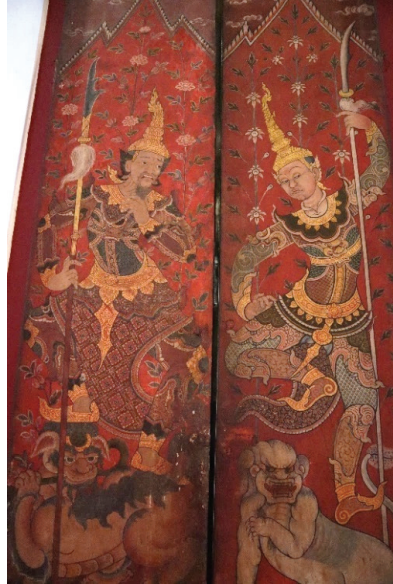
ภาพ 7 ภาพทวารบาลแบบจีนหรือเขี้ยวกาง พระอุโบสถ วัดสุวรรณาราม

ที่มาภาพ: ผู้วิจัย ถ่ายเมื่อวันที่ 6 เมษายน 2564