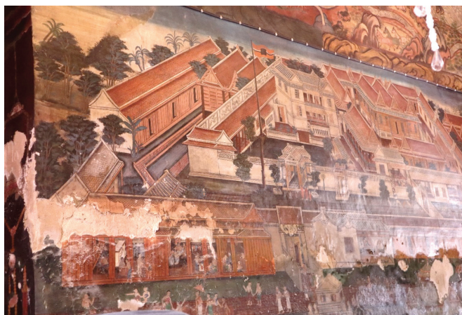
ภาพ 33 ภาพชำรุด: ภาพเรือนไทยสามหลังแฝดอยู่ติดกับบ้านตึกแบบจีน ด้านหน้าเป็นร้านค้า ผนังด้านหลังพระประธาน ณ พระอุโบสถ วัดทองธรรมชาติ