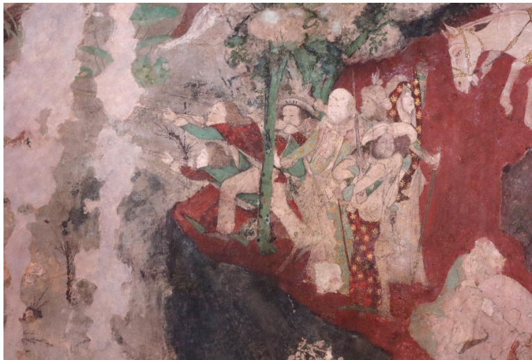
ภาพ 22 กลุ่มคนฝรั่งปะปนกับแขก ผนังเรื่องมโหสถชาดก ณ พระอุโบสถ วัดสุวรณาราม ที่มาภาพ: ผู้วิจัย ถ่ายเมื่อวันที่ 6 เมษายน 2564