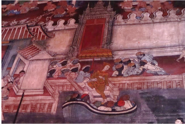
ภาพ 23 กลุ่มแขกเป็นผู้รับใช้เจ้านายริมทำน้ำ ณ พระอุโบสถ วัดกัลยาณมิตร ถ่ายเมื่อวันที่ 6 เมษายน 2564