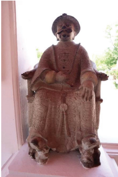
ภาพ 2 ตุ๊กตาหินชาวจีนแต่งกายแบบแมนจู พระอุโบสถ วัดทองธรรมชาติ ที่มาภาพ: ผู้วิจัย ถ่ายเมื่อวันที่ 6 เมษายน 2564

ลัทธิมั่งคั่ง ศาลเจ้าแบบเก็งจีน สถูปหรือเจดีย์จีนที่เรียกว่า “อะ” ดังที่ได้ปรากฏในบริเวณทั้งสามวัดในพื้นที่วิจัย ส่วนในด้านจิตรกรรมภายในพระอุโบสถ วิหาร และเพดาน มักปรากฏลวดลายแบบจีน โดยเฉพาะลวดลายดอกไม้วัง ดังเช่นพระอุโบสถและพระวิหารหลวงของวัดกัลยาณมิตร ศิลปกรรมแบบจีนนี้ได้แสดงให้เห็นถึงความสัมพันธ์ระหว่างไทยกับจีนทั้งทางการเมือง เศรษฐกิจและสังคมที่แนบแน่น