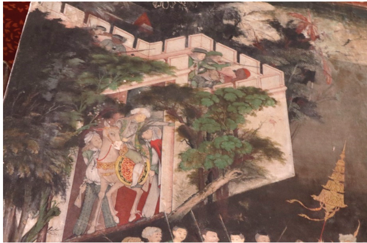
ภาพ 19 ทหารรับจ้างชาวเปอร์เซียและชาวตะวันตก ผันเรื่องมโหสถชาดก ณ พระอุโบสถ วัดสุวรรณาราม ที่มาภาพ: ผู้วิจัย ถ่ายเมื่อวันที่ 6 เมษายน 2564