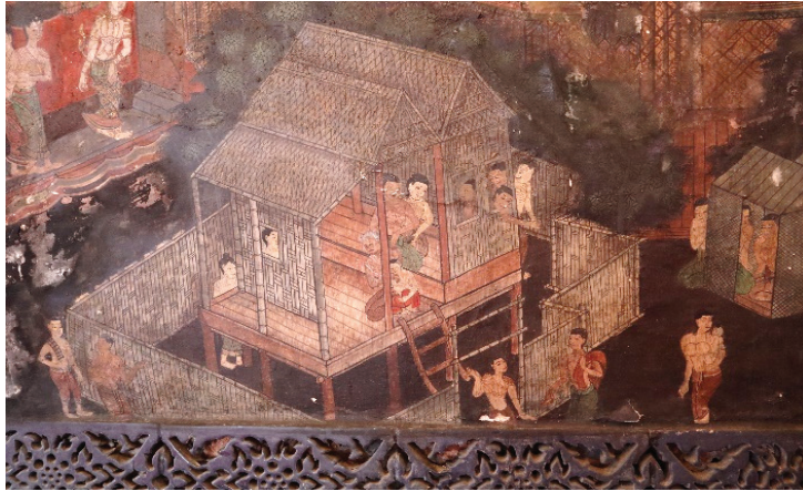
ภาพ 27 ชุดภาพชมมหรสพ: เรือนชั้วคราวชมมหรสพ ผนังด้านข้างของพระอุโบสถ วัดทองธรรมชาติ ถ่ายเมื่อวันที่ 6 เมษายน 2564