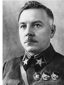
ภาพที่ 6 Kliment Yefremovich Voroshilov