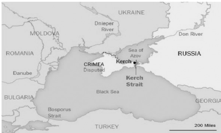
ภาพที่ 1 ภาพแสดงที่ตั้งของแหลมไครเมีย

แหลมไครเมียในมุมมองทางประวัติศาสตร์ของรัสเซียมีความสำคัญเชื่อมโยงต่อความสัมพันธ์กับยูเครนในทางภูมิศาสตร์ ด้วยเหตุผลที่ตั้งมีส่วนติดกับรัสเซียโดยตรง จากภาพที่ 1 พบว่าฝั่งตะวันตกเชื่อมโยงไปถึงโรมาเนีย ส่วนยูเครนตั้งแต่ทางทิศเหนือจนถึงตะวันออกเฉียงเหนือ และส่วนของทิศตะวันออกจะติดกับรัสเซีย มีทะเลอะซอฟ (Azov Sea) บริเวณทางฝั่งตะวันออกเฉียงเหนือ และสำคัญคือล้อมรอบด้วยทะเลดำ (Black sea) ตั้งอยู่ทางตอนใต้ ถือเป็นทะเลน้ำอุ่นเชื่อมต่อยังทะเลเมดิเตอร์เรเนียน (Mediterranean sea) ผ่านช่องแคบดาร์ดาเนลล์ (Dardanelles) และบอสפורัส (Bosporus) ของตุรกี