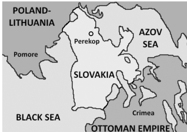
ภาพที่ 3 จุดที่ตั้งของเปเรคอป (Perekop)