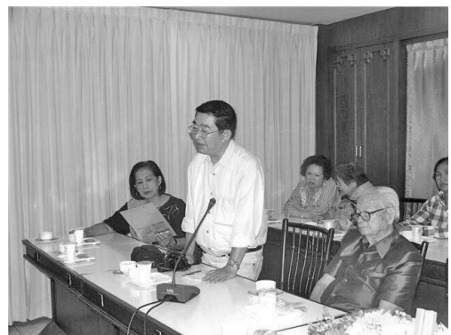
การสอบค้นเมืองฉอดโบราณของขุนสามชนใน พ.ศ. 2533 ของสมาคมประวัติศาสตร์ฯ