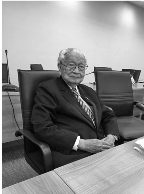
ศาสตราจารย์ ดร.ประเสริฐ ณ นคร ในวัย 99 ปี

ผลงานของ ศ. ดร.ประเสริฐมีมากมายหลายด้าน เช่น ประวัติศาสตร์สุโขทัย อยุธยา ล้านนา การอ่านจารึก วรรณกรรม ประพันธ์เนื้อเพลง ทำนองเพลงพระราชนิพนธ์ และทั่วไป ซึ่งยากจะกล่าวถึงให้ครอบคลุมได้ในบทความสั้น ๆ นี้ จึงขอกล่าวถึงเฉพาะผลงานที่เป็นความก้าวหน้าในการศึกษาประวัติศาสตร์สุโขทัยที่เป็นที่ยอมรับและใช้สอนในวิชาประวัติศาสตร์ของนักเรียนชั้นประถมศึกษา มัธยมศึกษา ตลอดจนมหาวิทยาลัย