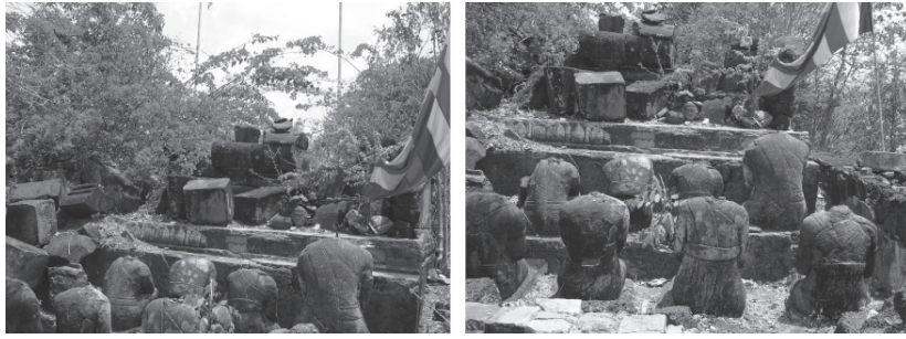
ภาพที่ 3 หมู่พระอรหันตสาวกและเหล่ากษัตริย์มัลละในท่าประทับนั่งประนมมือเรียงเป็น 2 แถวหน้าแท่นพระพุทธรูปไสยาสน์เมื่อวันที่ 24 มีนาคม พ.ศ. 2558

พระพุทธรูปขนาดใหญ่ขององค์พระพุทธรูปไสยาสน์ค่อนข้างสมบูรณ์ พระบาทซ้าย (พระบาทบน) สมบูรณ์กว่าวางซ้อนบนพระบาทขวา (พระบาทล่าง) ที่ฝ่าพระบาทปรากฏลายสลักเครื่องหมายมงคล 108 ประการอยู่เต็มทั้งฝ่าพระบาท (ภาพที่ 4)