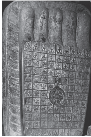
ภาพที่ 7 รอยพระพุทธรูปบาทที่เคยประดิษฐานที่ปราสาทนครวัด ประเทศกัมพูชา ที่มา http://www.thapra.lib.su.ac.th/supatlib/picture ผู้ถ่ายรูป ศ.ม.จ.สุภัทรดิศ ดิศกุล สไลด์ชุด ศิลปะประเทศไทย สงวนลิขสิทธิ์โดยห้องสมุด ศ.ม.จ.สุภัทรดิศ ดิศกุล