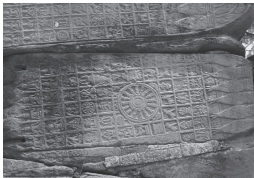
ภาพที่ 6 ลวดลายมงคลบนฝาพระบาทข้างขวา (ฝาพระบาทล่าง) ไม่สมบูรณ์ ผู้วิจัยถ่ายเมื่อวันที่ 24 มีนาคม พ.ศ. 2558