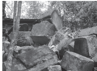
ภาพที่ 2 ฐานวิหารและชิ้นส่วนพระพุทโธไสยาสน์ที่ประดิษฐานเป็นประธานอยู่ภายใน ผู้วิจัยถ่ายเมื่อวันที่ 24 มีนาคม พ.ศ. 2558