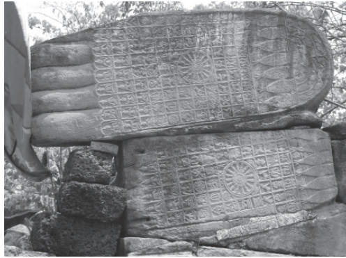
ภาพที่ 4 พระบาทคู่ขนาดใหญ่ของพระพุทธรูปไสยาสน์และลายมงคล 108 ประการที่ฝาพระบาททั้งสองข้าง ผู้วิจัยถ่ายเมื่อวันที่ 24 มีนาคม พ.ศ. 2558