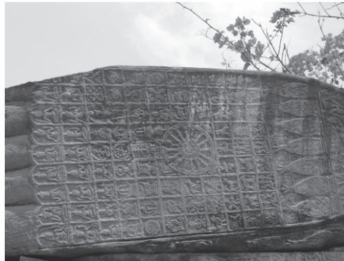
ภาพที่ 5 ลวดลายมงคลบนฝาพระบาทข้างซ้าย (ฝาพระบาทบน) ผู้วิจัยถ่ายเมื่อวันที่ 24 มีนาคม พ.ศ. 2558