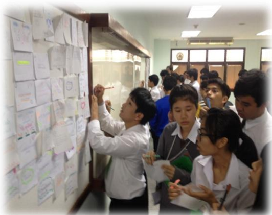
แผนภาพที่ 1 กิจกรรมการเรียนรู้ที่มีชีวิตชีวา

10. สามารถร่วมมือกับส่วนรวม ผู้ปกครอง และผู้มีส่วนเกี่ยวข้องในชุมชนวิชาชีพ ได้เป็นอย่างดี เพื่อพัฒนาผู้เรียนอย่างรอบด้าน