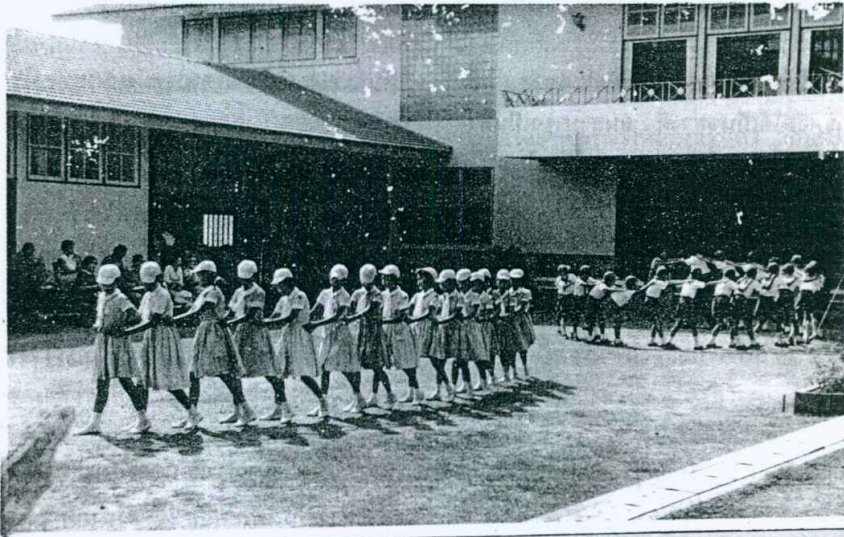
การเล่นส่วนหนึ่ง ของนักเรียนประถมสาธิต ประสานมิตร