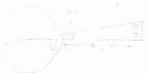
รูปที่ ๒ แผนผังเบื้องต้น

การศึกษาค้นคว้าเกี่ยวกับโรงเรียนมัธยมศึกษา ในประเทศไทย ได้มีมาตั้งแต่ปี พ.ศ. ๒๕๐๐ ซึ่งในระยะแรกนั้น การศึกษาค้นคว้าเกี่ยวกับโรงเรียนมัธยมศึกษา ได้มีขึ้นในรูปของงานวิจัยที่ดำเนินการโดยนักศึกษาระดับปริญญาโทและปริญญาเอก ซึ่งงานวิจัยเหล่านี้ได้แสดงให้เห็นถึงความสำคัญของการศึกษาค้นคว้าเกี่ยวกับโรงเรียนมัธยมศึกษา และแสดงให้เห็นถึงแนวทางในการศึกษาค้นคว้าเกี่ยวกับโรงเรียนมัธยมศึกษา ซึ่งแนวทางในการศึกษาค้นคว้าเกี่ยวกับโรงเรียนมัธยมศึกษา นั้นได้มีขึ้นในรูปของงานวิจัยที่ดำเนินการโดยนักศึกษาระดับปริญญาโทและปริญญาเอก ซึ่งงานวิจัยเหล่านี้ได้แสดงให้เห็นถึงความสำคัญของการศึกษาค้นคว้าเกี่ยวกับโรงเรียนมัธยมศึกษา และแสดงให้เห็นถึงแนวทางในการศึกษาค้นคว้าเกี่ยวกับโรงเรียนมัธยมศึกษา