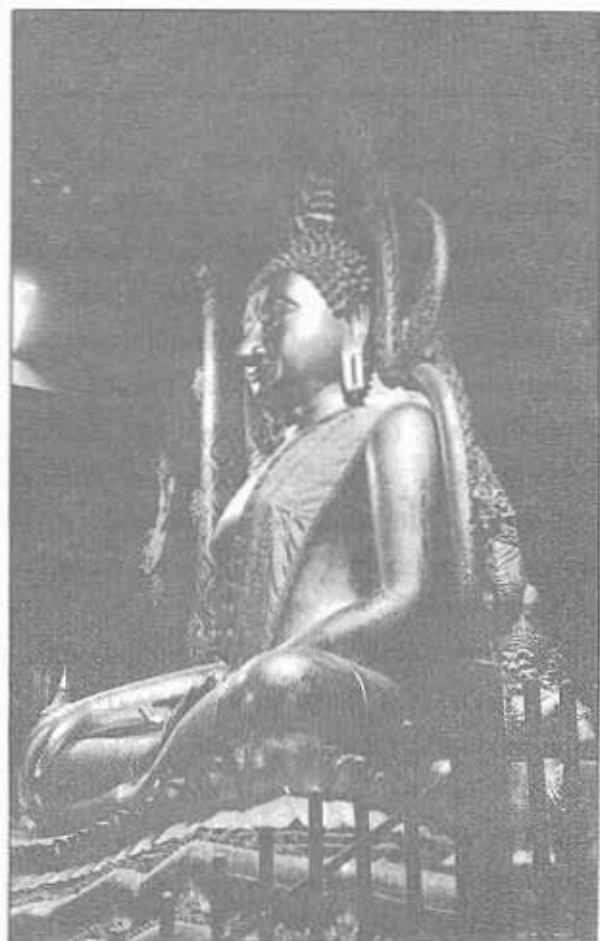
พระพุทธรชินราช วัดพระศรีรัตนมหาธาตุ จ.พิษณุโลก พุทธศิลป์สมัยสุโขทัยตอนปลาย