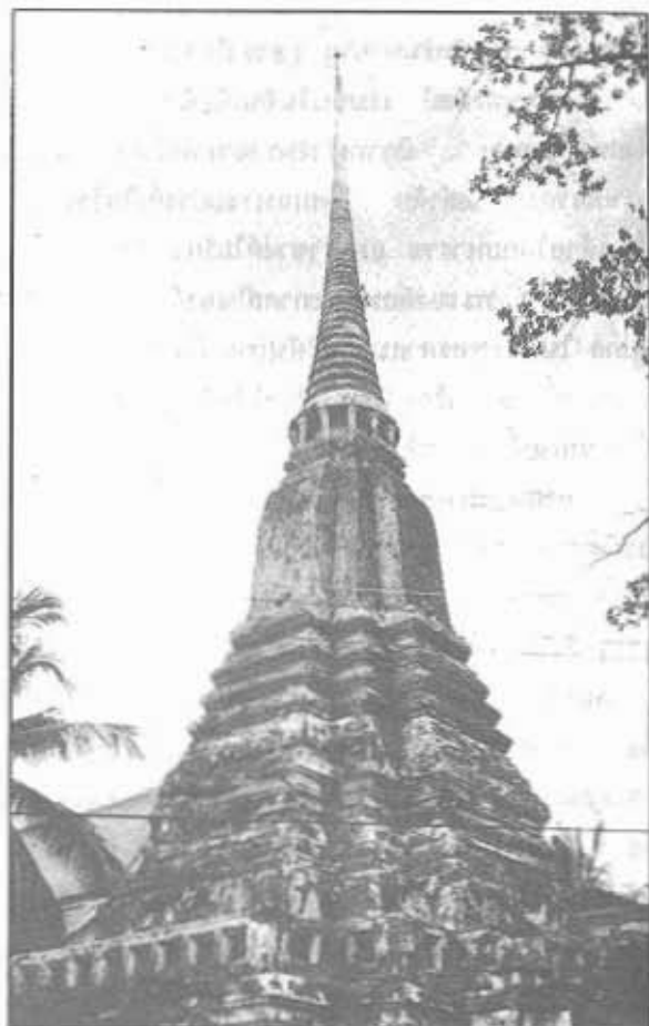
พระเจดีย์ย่อไม้สิบสอง วัดชุมพลนิกายาราม จ.พระนครศรีอยุธยา พุทธศิลป์สมัยอยุธยาตอนปลาย