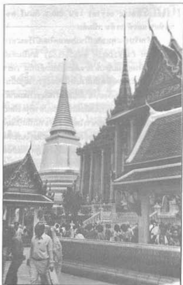
วัดพระศรีรัตนศาสดาราม พุทธศิลป์สมัยรัตนโกสินทร์ ตอนต้น