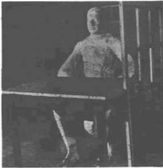
งานประติมากรรมของยอร์ช ซีกัล

กันระหว่างจิตรกรรม และประติมากรรม(ดูภาพประกอบ)