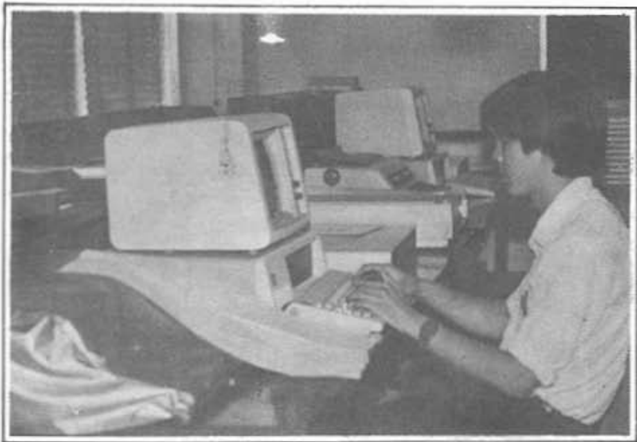
หอสมุคแห่งชาติได้ริเริ่มนำคอมพิวเตอร์มาใช้ในการดำเนินงาน ตั้งแต่ปี พ.ศ. ๒๕๑๘ และปัจจุบันได้นำไมโครคอมพิวเตอร์มาใช้ด้วย