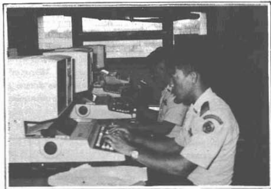
นักเรียนนายเรืออากาศขณะเรียนวิชาคอมพิวเตอร์