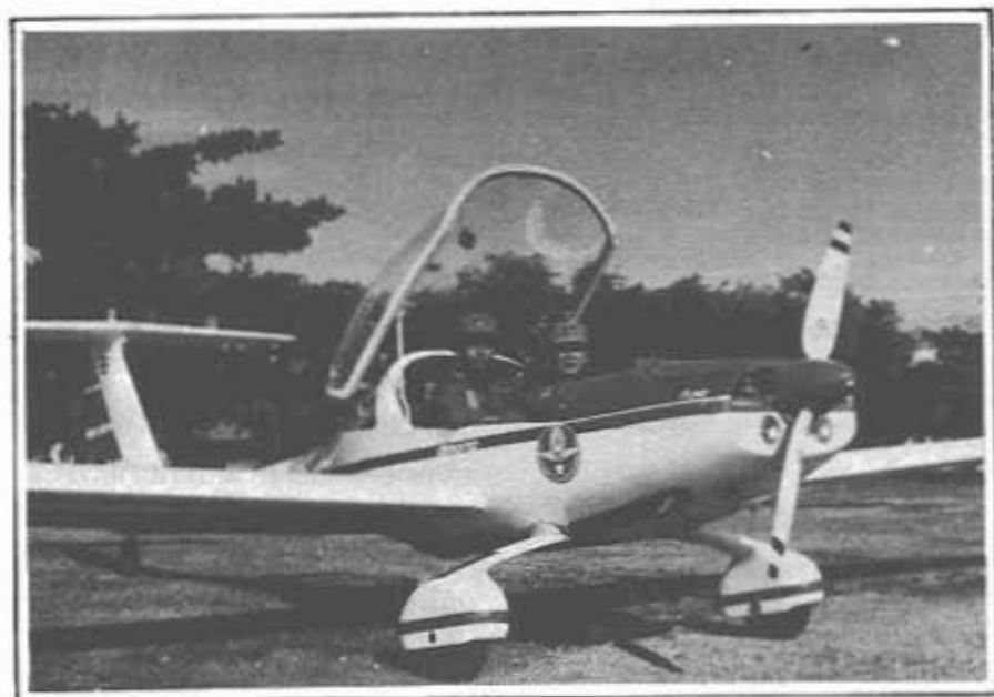
นักเรียนนายเรืออากาศ ขณะฝึกบินเครื่องบินร่อน