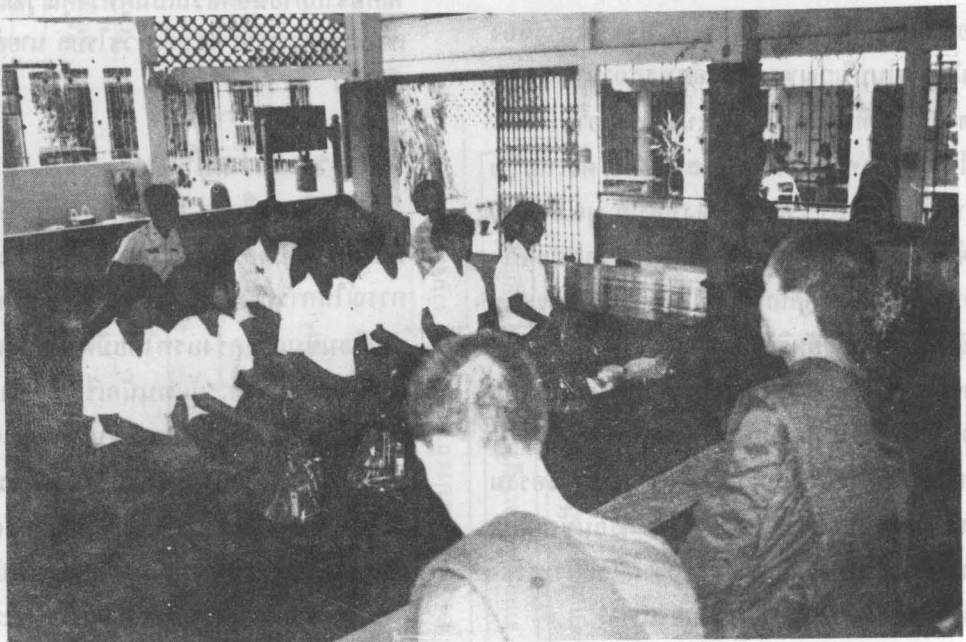
ทอดผ้าป่า ณ วัดราชผาติการาม

กิจกรรมด้านกีฬา โรงเรียนจิตรลดา มีกิจกรรมแข่งขันกีฬาประเพณีกับโรงเรียนสาริศจุลาลงกรณ์-