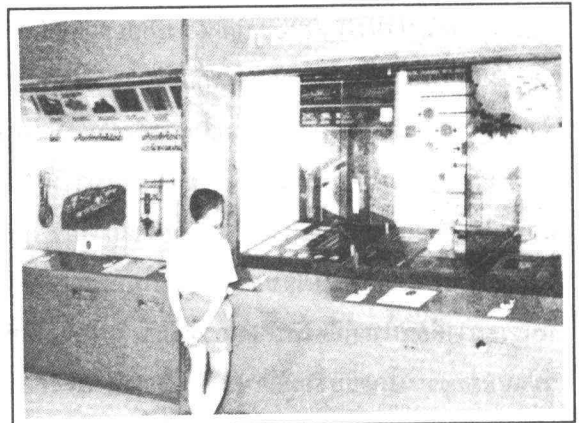
ภาพแสดงนิทรรศการแบบถาวร