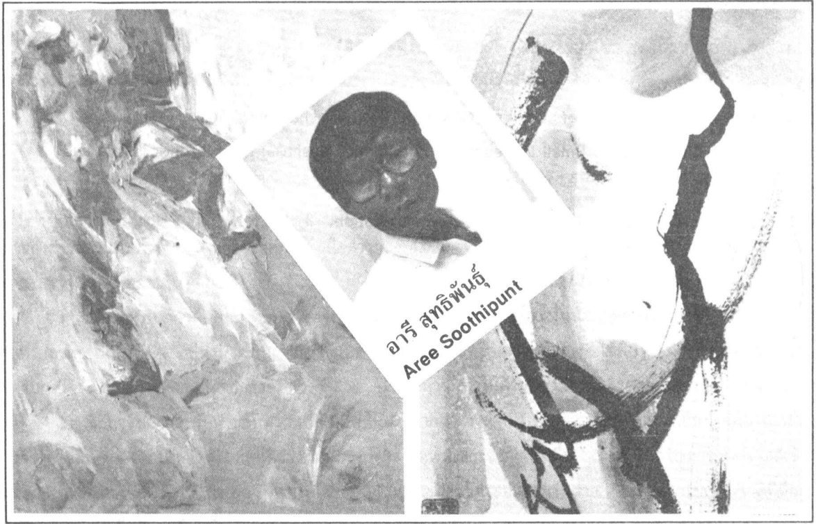
ภาพที่ 2 แสดงให้เห็นถึงการเน้นหรือจัดให้เกิดส่วนที่เด่น

2. เนื้อหาหรือสาระ หมายถึง มวลความรู้หรือสาระที่จะนำเสนอในแง่มุมต่างๆ เพื่อเป็นการเผยแพร่หรือสื่อสารเนื้อหาสาระเหล่านั้นแก่ผู้ชมนิทรรศการ ดังนั้นการออกแบบจึงควรเน้นที่การจัดระบบหมวดหมู่ การลำดับเนื้อหา ความเชื่อมโยงต่อเนื่อง ให้กระชับ และรัดกุมสามารถที่จะสื่อสารได้ตรงประเด็น ดังนั้นสิ่งสำคัญคือวิธีการถ่ายทอดเนื้อหาสาระให้ผู้ชมได้เข้าใจและรับรู้อย่างมีประสิทธิภาพ นักออกแบบจำเป็นต้องร่วมมือกับนักวิชาการเพื่อติดต่อสื่อสารในการถ่ายทอดเนื้อหาสาระเหล่านั้นเพื่อให้ได้รูปแบบที่สอดคล้องกับจุดมุ่งหมายยิ่งขึ้น