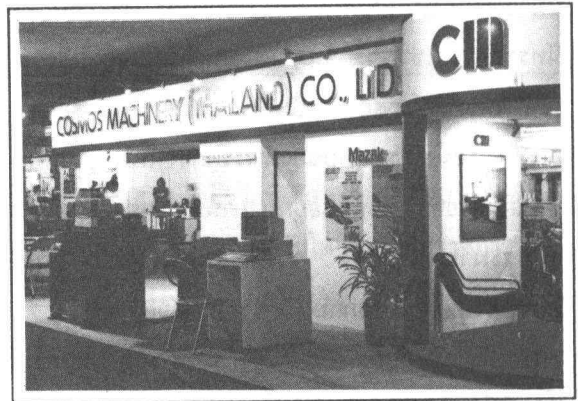
ภาพแสดงนิทรรศการแบบชั่วคราว ออกแบบโดย สินีนาถ เลิศไพโรจน์