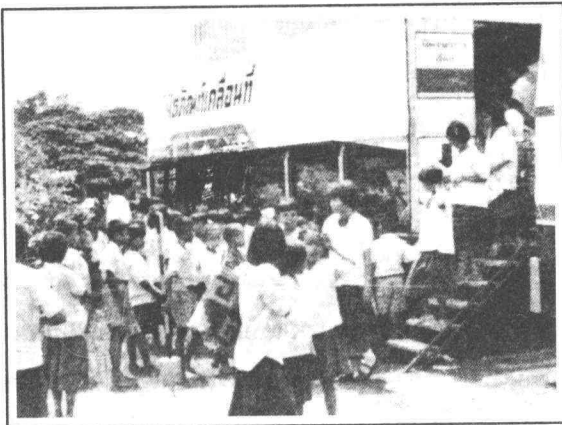
ภาพแสดงนิทรรศการแบบเคลื่อนที่