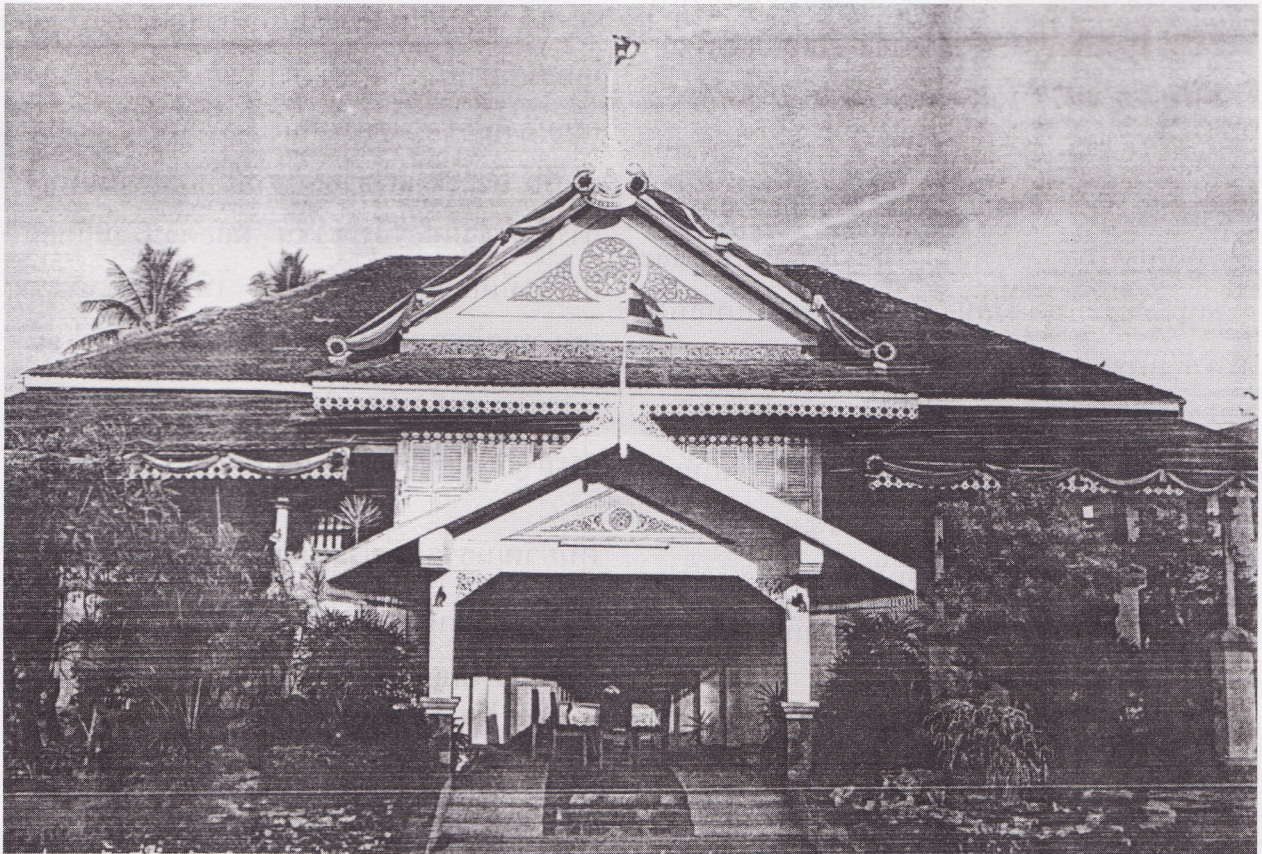
อาคารวังเจ้าเมืองยะหริ่ง

ความดำริของเจ้าของบ้าน จะเปิดบ้านแห่งนี้เป็น ศูนย์วัฒนธรรมมุสลิม จัดให้มีกิจกรรมต่างๆ เหมือนครั้งที่เจ้าเมืองยังมีชีวิตอยู่ เช่น ตอนค่ำจัดให้มีการเลี้ยงอาหารค่ำแบบชาววังดั้งเดิมที่สนามหญ้าหน้าวัง มีการแสดงรองเงิง รำกริช และสืละ บรรเลงดนตรีของชาวมุสลิม เป็นต้น