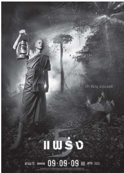
ภาพที่ 2 ภาพโปสเตอร์ภาพยนตร์เรื่อง 5 แพร่ง

ภาพยนตร์เรื่อง 5 แพร่ง ตอน หลาวชะโอน ของ จีทีเอช ผู้กำกับคือ ปวีณ ภูริจิตปัญญา ออกฉายในปี พ.ศ. 2552 ภาพยนตร์เรื่องนี้จัดเป็น ภาพยนตร์ประเภทผี-สยองขวัญ [18]