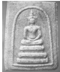
2. พิมพ์ทรงเทวดา