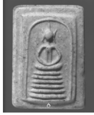
2. พิมพ์ฐานหกชั้นนอกตัน