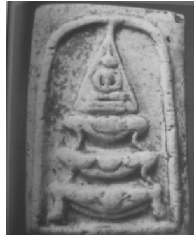
3. พิมพ์ทรงเจดีย์ใหญ่