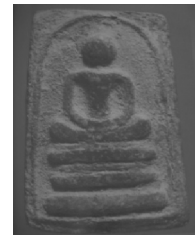
5. พิมพ์ตะกั่วถ้ำชา

ภาพที่ 4 (ลำดับ 1 - 5) แสดงพระสมเด็จกลุ่มพิมพ์พิเศษ พิมพ์โกเชอร์ พิมพ์ทรงเทวดา พิมพ์ทรงเจดีย์ใหญ่ พิมพ์เจดีย์แหวกมาน และพิมพ์ตะกั่วถ้ำชา