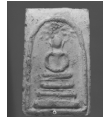
5. พิมพ์ปรกโพธิ์