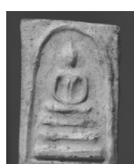
8. พิมพ์สังฆาฏิ