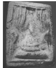
4. พิมพ์เจดีย์แหวกมาน