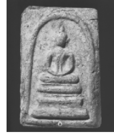
4. พิมพ์เกศบัวตูม

ภาพที่ 1 (ลำดับ 1 - 4) แสดงพระสมเด็จวัดระฆังพิมพ์ใหญ่ พิมพ์ทรงเจดีย์ พิมพ์ฐานแซม และพิมพ์เกศบัวตูม [5]