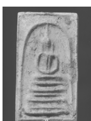
7. พิมพ์ฐานคู่