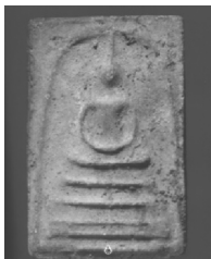
6. พิมพ์เส้นด้าย