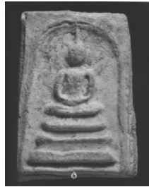
2. พิมพ์ทรงเจดีย์