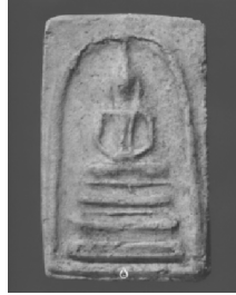
3. พิมพ์ฐานแซม