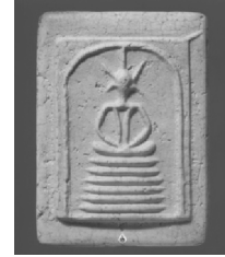
3. พิมพ์ฐานหกชั้นนอกตลอด

ภาพที่ 3 (ลำดับ 1 - 3) แสดงพระสมเด็จวัดเกตไชโย พิมพ์นิยมฐานเจ็ดชั้น พิมพ์ฐานหกชั้นนอกตัน และพิมพ์ฐานหกชั้นนอกตลอด