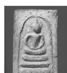
10. พิมพ์อกรุขุเศียรบาตร

ภาพที่ 2 (ลำดับ 1 - 10) แสดงพระสมเด็จวัดบางขุนพรหมพิมพ์ใหญ่ พิมพ์เจดีย์ พิมพ์ฐานแซม พิมพ์เกศบัวตูม พิมพ์ปรกโพธิ์ พิมพ์เส้นด้าย พิมพ์ฐานคู่ พิมพ์สังฆาฏิ พิมพ์สังฆาฏิหูช้าง พิมพ์อกรุขุเศียรบาตร