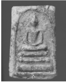
1. พิมพ์ใหญ่