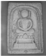
1. พิมพ์โกเชอร์

1.1.2 กลุ่มพระสมเด็จพิมพ์พิเศษ หรือเรียกอีกอย่างหนึ่งว่า “พระสมเด็จนอกพิมพ์” ซึ่งเป็นพระสมเด็จที่ไม่นิยมเล่นกันโดยทั่วไป มีเพียงบางกลุ่มเท่านั้น จะด้วยเหตุว่าเป็นของหายาก และมีจำนวนน้อย เช่น พิมพ์โกเชอร์ พิมพ์ทรงเทวดา พิมพ์ทรงเจดีย์ใหญ่ พิมพ์เจดีย์แหวกมาน พิมพ์ตะกั่วถ้ำชา เป็นต้น