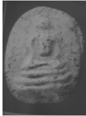
ภาพที่ 6 แสดงพระสมเด็จชุดพิมพ์ทรงวงกลม พิมพ์พิเศษเล็บมือ ที่มา: แฉล้ม โชติช่วง; และ มนัส ยอจันทร์ [2]

พระพิมพ์สกุลสมเด็จพระพุฒาจารย์มีลักษณะกายภาพทางศิลปะด้วยการมีคุณสมบัติตรงตามส่วนประกอบของการออกแบบ (Elements of Design) หลักการออกแบบ (Principles of Design) [6] และสุนทรียลักษณ์ของสกุลช่างพุทธศิลป์ [7] ได้อย่างเหมาะสม ซึ่งสามารถแบ่งออกได้เป็น 2 ลักษณะคือ