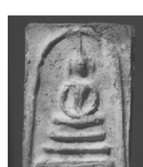
9. พิมพ์สังฆาฏิหูช้าง