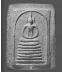
1. พิมพ์นิยมฐานเจ็ดชั้น