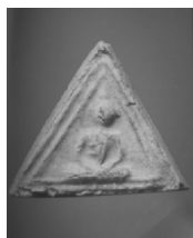
1. พิมพ์พิเศษหมอนขวาน

1.2 ชุดพิมพ์ทรงสามเหลี่ยม ได้แก่ พระสมเด็จพิมพ์พิเศษต่างๆ เช่น พิมพ์พิเศษหมอนขวาน พิมพ์พิเศษหน้าบัน เป็นต้น