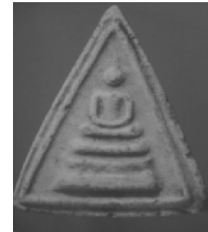
2. พิมพ์พิเศษหน้าบัน

ภาพที่ 5 (1-2) แสดงพระสมเด็จชุดทรงสามเหลี่ยม พิมพ์พิเศษหมอนขวาน และพิมพ์พิเศษหน้าบัน