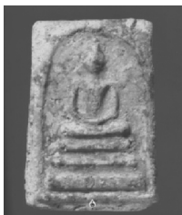
1. พิมพ์ใหญ่