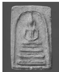
3. พิมพ์ฐานแซม