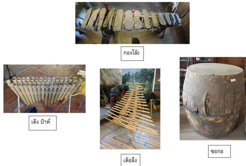
ภาพที่ 2 เครื่องดนตรีของชาวเกอฮอลัด

รวมไปถึงชาวเกอฮอลัดยังมีบทเพลงที่ใช้ขับร้องร่วมกับการบรรเลงทำนองของเครื่องดนตรีอยู่มากมาย โดยในแต่ละบทเพลงนั้นขึ้นอยู่กับกรหีบนำไปใช้ให้เหมาะสมกับโอกาสต่าง ๆ แต่มีบทเพลงที่ถือได้ว่ามีความสำคัญต่อชาวเกอฮอลัด และมักจะถูกนำมาบรรเลงเป็นเพลงแรกในการแสดงเสมอ คือ บทเพลง โอ มิ ซึ่งเป็นบทเพลงที่กล่าวถึงพี่น้องที่ร่วมมือกันคิดหาทางออกในการทำมาหากิน ซึ่งชาวเกอฮอลัดจะใช้ในงานรื่นเริง และสร้างความสนุกสนานก่อนเริ่มงานหรือพิธีมงคล โดยผู้วิจัยได้นำเนื้อเพลงมาแปลเป็นภาษาไทย ดังนี้