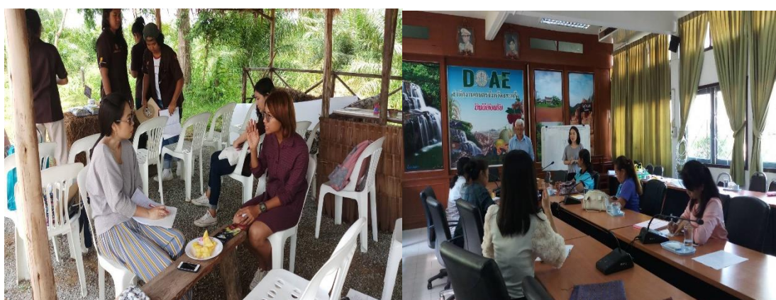
ภาพที่ 1 การประชุมแบบมีส่วนร่วมระหว่างวิสาหกิจชุมชนจักสานและผ้าทอกับนักวิชาการ

กลุ่ม/กิจกรรมเพื่อให้เกิดการเปลี่ยนแนวคิดเดิมจากทำคนเดียวได้คนเดียว มารวมกลุ่มเพื่อให้เกิดการเปลี่ยนแปลงของกลุ่มอาชีพให้เกิดความเข้มแข็งยิ่งขึ้น 2) ดำเนินการปรับพฤติกรรมเดิม เมื่อเกิดการรวมกลุ่มแล้ว ย่อมทำให้มีกำลังคนเพื่อพัฒนาคุณภาพมากขึ้น ร่วมคิดร่วมดำเนินการ ซึ่งผู้นำกลุ่มต้องแสดงภาวะผู้นำ โดยการกระจายความรับผิดชอบให้กับสมาชิกของกลุ่ม มีการกำหนดบทบาทหน้าที่อย่างชัดเจน มีการกำหนดการประชุมเพื่อให้สมาชิกกลุ่มมาพบปะกันเพื่อแลกเปลี่ยนความคิดเห็นต่าง ๆ เน้นการรับฟังความคิดเห็นของสมาชิก เพื่อหาข้อตกลงร่วมกันและเป็นไปตามความต้องการของสมาชิก ให้เกิดการดำเนินงานอย่างต่อเนื่องและสม่ำเสมอ และ 3) การรักษาพฤติกรรมที่เปลี่ยนแปลง ความต่อเนื่องและสม่ำเสมอถือเป็นการดำเนินงานเพื่อให้การพัฒนาอย่างยั่งยืน นั่นคือ หากกลุ่มเกิดการรวมตัวกันแล้วและมีการปรับเปลี่ยนพฤติกรรมในแนวทางที่เหมาะสม ผู้นำหรือสมาชิกของกลุ่มต้องหาสิ่งจูงใจที่ตอบสนองความต้องการของบุคคลเพื่อเป็นแรงผลักดันให้พฤติกรรมที่เปลี่ยนแปลงแล้วเป็นพฤติกรรมใหม่ ไม่กลับไปมีพฤติกรรมแบบเดิม ๆ อีกต่อไป