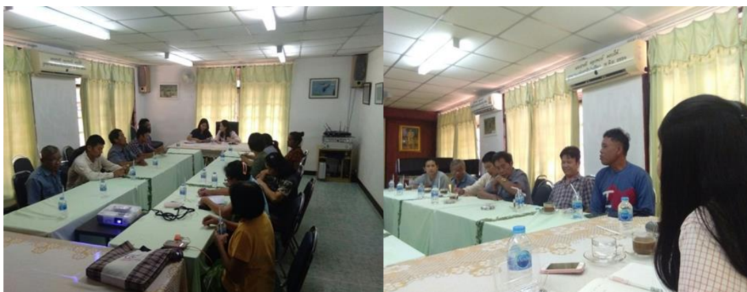
ภาพที่ 3 การประชุมแบบมีส่วนร่วมของคณะกรรมการหมู่บ้านคลองน้ำเขียว

4. การนำเทคโนโลยีมาใช้ในกระบวนการผลิตสินค้า (นวัตกรรม) เพื่อให้เกิดการรับรองมาตรฐาน ด้วยกระบวนการผลิตผ้าทอ/จักสานยังเป็นลักษณะของงานฝีมือที่อาศัยแรงงานคนที่มีความชำนาญ/ต้องเป็นแรงงานฝีมือ ดังนั้นนวัตกรรมที่เกิดขึ้น จึงเป็นนวัตกรรมทางความคิดให้เกิดการสร้างสรรคผลงานมากกว่าการนำเทคโนโลยีสมัยใหม่ที่เป็นเครื่องจักรหรือเครื่องมือเพื่อเพิ่มปริมาณการผลิตให้มากขึ้นหรือการผลิตซ้ำ การสืบสานลวดลายผ้าทอแบบดั้งเดิมถือเป็นการอนุรักษ์ศิลปวัฒนธรรมท้องถิ่นในขณะเดียวกันก็สร้างสรรค์ลวดลายผ้าทอ/จักสานใหม่ตามความต้องการของผู้บริโภคทั้งในและต่างประเทศ ด้วยการสร้างสรรค์รูปแบบผลิตภัณฑ์ที่หลากหลายในด้านประโยชน์การใช้สอย โดยการสร้างสรรค์ผลงานที่เกิดขึ้นนี้ จะต้องมีการจดลิขสิทธิ์ทางปัญญาของผลิตภัณฑ์ชุมชน เพื่อป้องกันการลอกเลียนแบบและยังช่วยสร้างมาตรฐานของผลิตภัณฑ์ชุมชนอีกด้วย ทั้งนี้การเกิดนวัตกรรมทางความคิดย่อมอาศัยเยาวชนรุ่นใหม่ของชุมชนที่ออกไปศึกษาเรียนรู้ในสถาบันศึกษาต่าง ๆ ทั้งในและต่างประเทศ โดยชุมชนจะต้องส่งเสริมและสนับสนุนให้เยาวชนกลับมาพัฒนาถิ่นฐานบ้านเกิดของตนเอง