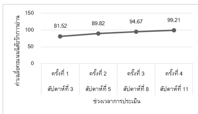
ภาพที่ 4 ผลการเปรียบเทียบค่าเฉลี่ยของคะแนนพัฒนาการนิสัร้การอ่านในภาพรวมของกลุ่มตัวอย่าง จำแนกตามช่วงเวลา (N=33)

ระดับคะแนนของนิสัร้การอ่านในภาพรวมของกลุ่มตัวอย่างจากการทดสอบครั้งที่ 1-4 มีคะแนนเฉลี่ยสูงขึ้นตามลำดับ คือ 81.52 89.82 94.67 และ 99.21