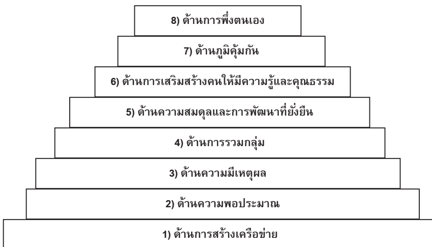
ภาพที่ 2 ตัวแบบการบริหารจัดการพื้นที่มรดกโลกในจังหวัดพระนครศรีอยุธยาของเทศบาลนครพระนครศรีอยุธยาตามปรัชญาของเศรษฐกิจพอเพียง

4. ตัวแบบการบริหารจัดการพื้นที่มรดกโลกในจังหวัดพระนครศรีอยุธยาของเทศบาลนครพระนครศรีอยุธยาตามปรัชญาของเศรษฐกิจพอเพียง ควรประกอบด้วย 8 ด้านโดยเรียงตามลำดับจากมากไปน้อย ดังนี้ (1) ด้านการสร้างเครือข่าย (2) ด้านความพอประมาณ (3) ด้านความมีเหตุผล (4) ด้านการรวมกลุ่ม (5) ด้านความสมดุลและการพัฒนาที่ยั่งยืน (6) ด้านการเสริมสร้างคนให้มีความรู้และคุณธรรม (7) ด้านภูมิคุ้มกัน และ (8) ด้านการพึ่งตนเอง โดยการจัดลำดับความสำคัญของอิทธิพลของตัวแบบการบริหารจัดการพื้นที่มรดกโลกในจังหวัดพระนครศรีอยุธยาของเทศบาลนครพระนครศรีอยุธยาตามปรัชญาของเศรษฐกิจพอเพียง (ตัวแปรอิสระ) ที่มีต่อประสิทธิภาพในการบริหารจัดการที่เรียกว่า 6M (ตัวแปรตาม) มีเงื่อนไข ดังนี้ (1) ผู้ศึกษาเลือกตัวแปรอิสระที่มีอิทธิพลต่อตัวแปรตาม โดยพิจารณาตามจำนวนด้านของตัวแปรตามมาเป็นลำดับแรก และ (2) กรณีที่ตัวแปรอิสระมีอิทธิพลตัวแปรตามในจำนวนด้านที่เท่ากัน ผู้ศึกษาพิจารณาจากระดับอิทธิพลของตัวแปรอิสระ (ค่า B) ที่สูงสุดในแต่ละด้านมาเป็นลำดับแรก และลำดับรอง ตามลำดับดังภาพที่ 2