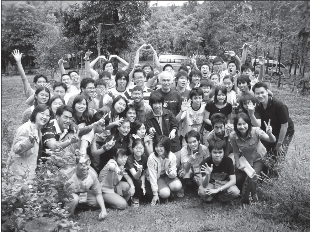
รูปที่ 2 โครงการ JSTP ของ สวทช. เป็นโครงการที่พัฒนาเยาวชนโดยใช้ระบบนักวิทยาศาสตร์พี่เลี้ยง เพื่อให้เยาวชนได้เติบโตเป็นนักวิจัยที่ดีมีคุณภาพสูงและมีความสุข