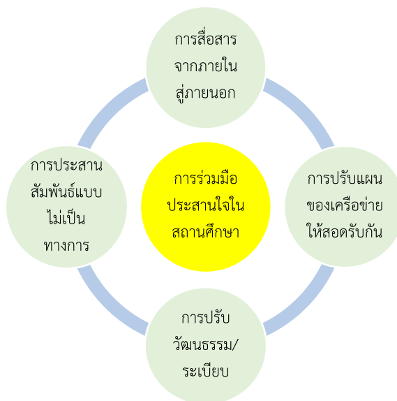
แผนภาพที่ 5 แนวทางการพัฒนาการจัดการศึกษาสำหรับเด็กที่มีความต้องการพิเศษ โดยการมีส่วนร่วมของชุมชน

จากการสังเคราะห์รูปแบบการจัดการศึกษาสำหรับเด็กที่มีความต้องการพิเศษโดยการมีส่วนร่วมของชุมชน และข้อเสนอแนะในการจัดการศึกษาสำหรับเด็กที่มีความต้องการพิเศษโดยการมีส่วนร่วมของชุมชน สามารถสกัดและนำเสนอแนวทางเป็น 5C ประกอบด้วย 2 ระดับ ได้แก่ 1) การเสริมสร้างความเข้มแข็งระดับสถานศึกษา เน้นการร่วมมือประสานใจในสถานศึกษา (Collaboration) และ 2) การเสริมสร้างความเข้มแข็งระดับเครือข่ายการมีส่วนร่วม ประกอบด้วย 4C ได้แก่ (1) การประสานสัมพันธ์ที่ไม่เป็นทางการ (Coordination) (2) การสื่อสารจากภายในสู่ภายนอก (Communication) (3) การปรับแผนการดำเนินงานของเครือข่าย (Cooperation) และ (4) การปรับวัฒนธรรมหรือระเบียบ (Culture) ดังนี้