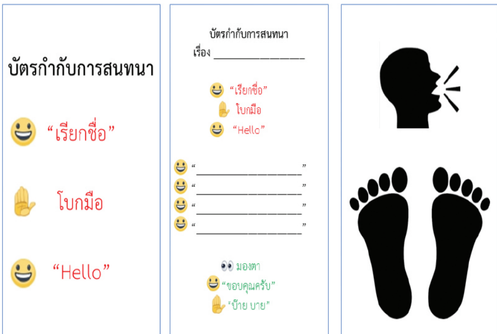
ภาพ 1 สื่อที่ใช้ร่วมกับแผนการสอนในงานวิจัย