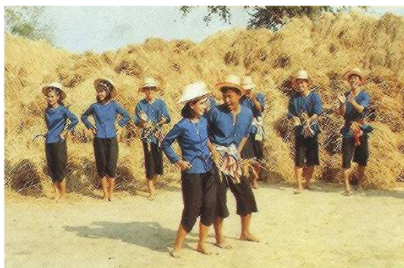
ภาพ 2 การละเล่นพื้นเมืองภาคกลาง:เต้นกำรำเคียว

ทางภาคตะวันออกเฉียงเหนือหรือชาวไทยอีสาน เป็นผู้สืบเชื้อสายเลือดเนื้อของชนชาติไทยหรืออ้ายลาวที่มาตั้งอาณาจักรล้านช้างในสมัยรัชกาลที่ 2 ชาวไทยกลุ่มอีสานแบ่งออกเป็นกลุ่มย่อยอีกคืออีสานเหนือและอีสานใต้ ส่วนใหญ่นับถือศาสนาพุทธ ภาษาที่ใช้คือภาษาไทยถิ่นอีสานและภาษาของชนกลุ่มน้อย นอกจากนี้ยังนับถือเทวดาที่เรียกว่าพญาแถนมีความเชื่อในเรื่องผีจึงมีพิธีกรรมที่แสดงออกถึงความเชื่อพร้อมกับการนับถือศาสนาเพื่อความอุดมสมบูรณ์แลความมั่นคงในการดำรงชีวิต