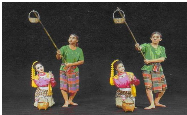
ภาพ 3 การละเล่นพื้นเมืองภาคตะวันออกเฉียงเหนือ : เซิ้งแห่ไข่มดแดง

ทางภาคตะวันออกเฉียงเหนือหรือชาวไทยอีสาน เป็นผู้สืบเชื้อสายเลือดเนื้อของชนชาติไทยหรืออ้ายลาวที่มาตั้งอาณาจักรล้านช้างในสมัยรัชกาลที่ 2 ชาวไทยกลุ่มอีสานแบ่งออกเป็นกลุ่มย่อยอีกคืออีสานเหนือและอีสานใต้ ส่วนใหญ่นับถือศาสนาพุทธ ภาษาที่ใช้คือภาษาไทยถิ่นอีสานและภาษาของชนกลุ่มน้อย นอกจากนี้ยังนับถือเทวดาที่เรียกว่าพญาแถนมีความเชื่อในเรื่องผีจึงมีพิธีกรรมที่แสดงออกถึงความเชื่อพร้อมกับการนับถือศาสนาเพื่อความอุดมสมบูรณ์แลความมั่นคงในการดำรงชีวิต