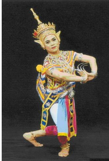
ภาพ 4 การละเล่นพื้นเมืองภาคใต้ : โนรา

พระ งานสารทเดือนสิบหรือที่เรียกว่าประเพณีชิงเปรต งานแห่ผ้าขึ้นธาตุ งานฮารีรายอฉลองการออกจากการถือศีลของชาวไทยมุสลิม งานฉลองเจ้าแม่ลิ้มกอเหนี่ยวของชาวจีน ประเพณีบวงสรวงบรรพบุรุษและเจ้าเกาะ พิธีลอยเรือนิยมเล่นรำมะนาของชาวเล