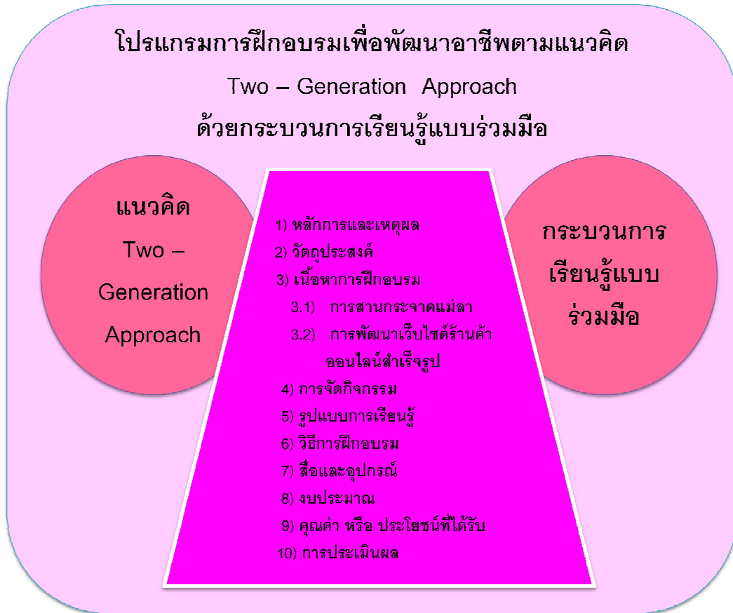
ภาพประกอบ 2 โปรแกรมการฝึกอบรมเพื่อพัฒนาอาชีพตามแนวคิด Two – Generation Approach ด้วยกระบวนการเรียนรู้แบบร่วมมือ