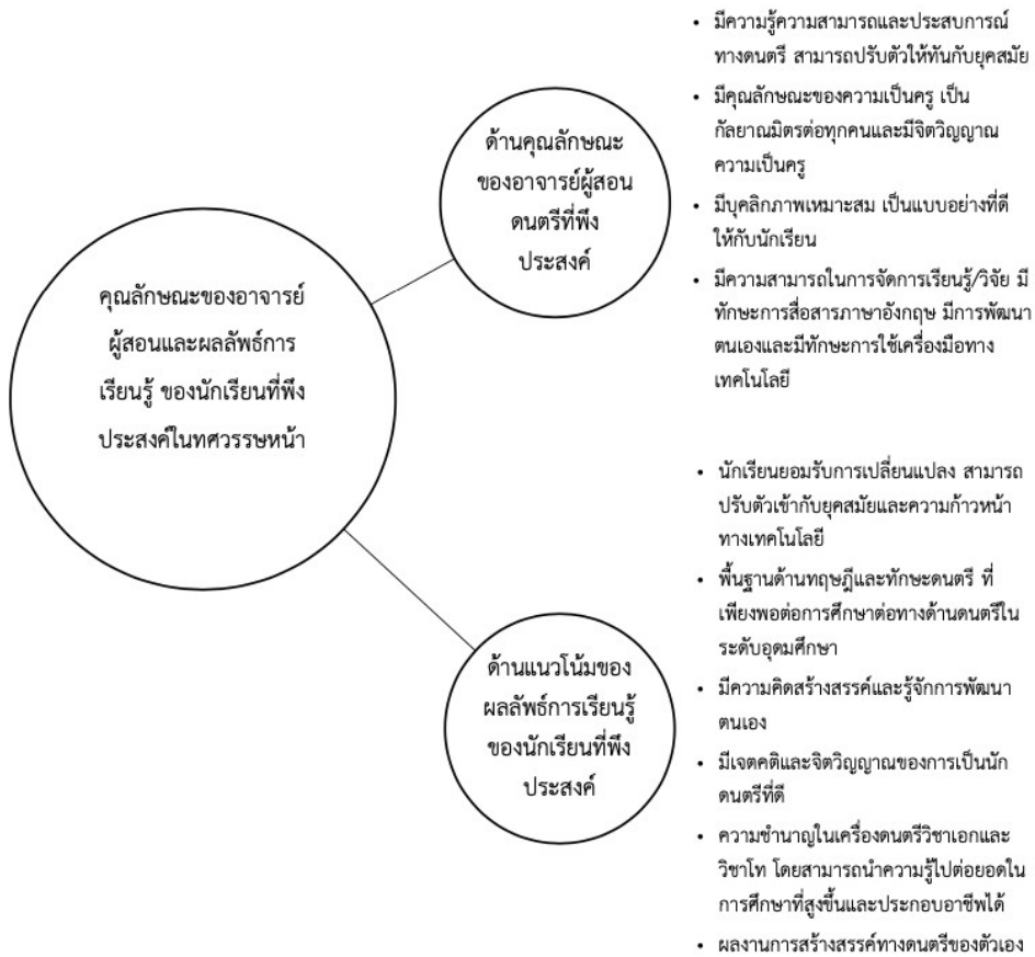
ภาพประกอบ 3 คุณลักษณะของอาจารย์ผู้สอนและผลลัพธ์การเรียนรู้ของนักเรียนที่พึงประสงค์ในทศวรรษหน้า (พ.ศ.2563 - 2573)