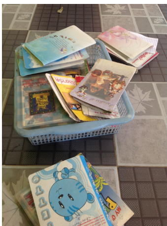
ภาพประกอบ 1 ลักษณะการจัดเก็บภาพถ่ายของกลุ่มสมุโนไฟรบ้านดงบัง

“ยังเป็นความรู้แบบแฝงอยู่ แต่จริง ๆ มีองค์ความรู้ที่หลากหลาย ซึ่งมันก็น่าเป็นห่วงเหมือนกันถ้าไม่มีการจดบันทึกต่อไปก็ต้องมีการบันทึก และถอดความรู้ของกลุ่มสมุโนไฟรบ้านดงบัง”