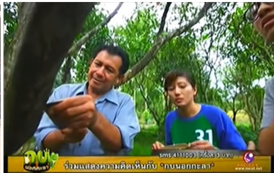
ภาพประกอบ 2 การเผยแพร่/ถ่ายทอดความรู้ของกลุ่มสมุนไพรมันดงบัง