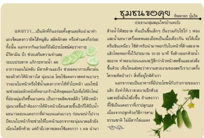
ภาพประกอบ 3 ความรู้ที่บันทึกในรูปแบบความรู้ที่ชัดเจนของกลุ่มสมุนไพรมานดงบัง

2.5 กระบวนการประยุกต์ใช้ความรู้ สมาชิกกลุ่มสมุนไพรมานดงบังมีการประยุกต์ใช้ความรู้ออกเป็น 2 ด้าน ได้แก่ 1) เพื่อการพัฒนาตนเอง โดยนำความรู้มาใช้ในการประกอบอาชีพ ใช้เพื่อการดูแลสุขภาพของตนเองและคนในครอบครัว และ 2) การใช้ความรู้เพื่อพัฒนาชุมชน มีการนำความรู้มาพัฒนาโครงสร้างเป็นผลิตภัณฑ์ของชุมชน รวมทั้งมีการนำความรู้มาใช้ในการดำเนินงานเพื่อเป็นแหล่งเรียนรู้ด้านสมุนไพรมาน นอกจากนี้ยังมีการประยุกต์ใช้ความรู้ในการแก้ปัญหาต่าง ๆ ของกลุ่ม