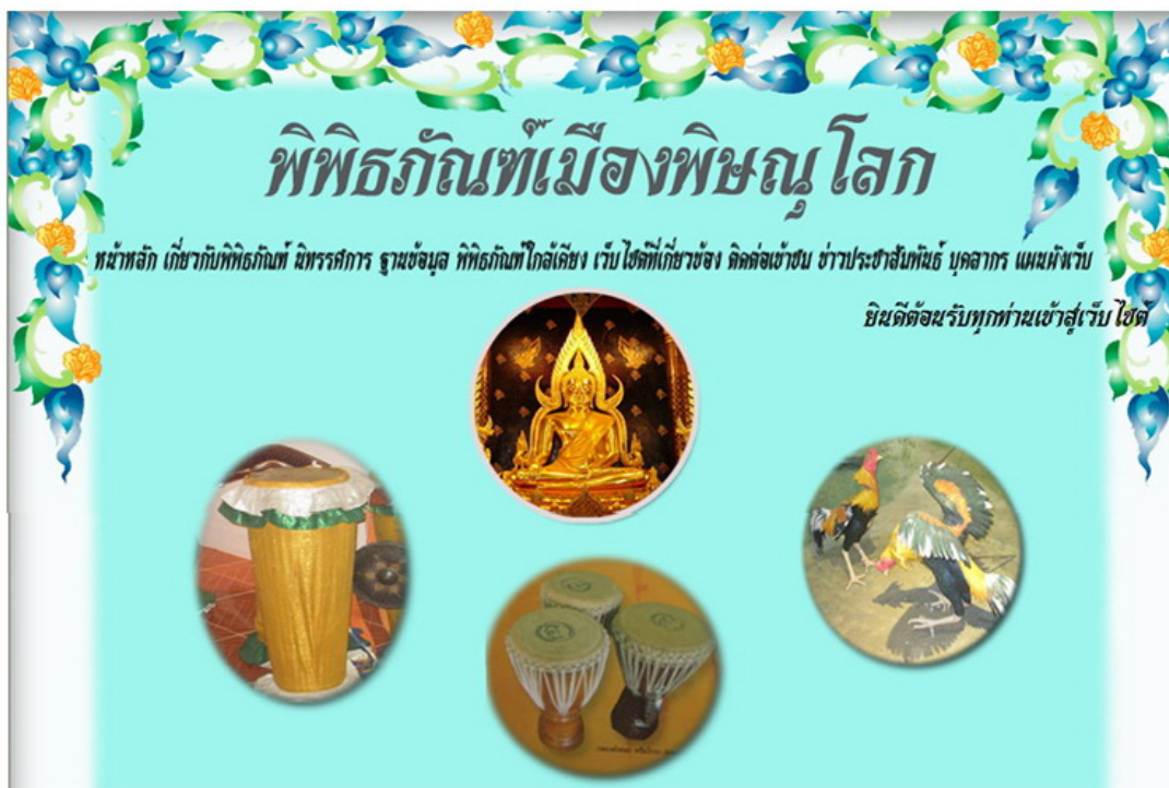
ภาพประกอบ 3 โส่มเพจเว็บไซต์พิพิธภัณฑ์เมืองพิษณุโลก

4.5 ควรเพิ่มจำนวนผู้มีส่วนร่วมในด้านผู้ใช้พิพิธภัณฑ์ให้มีจำนวนมากขึ้น เพื่อความชัดเจนในการกำหนดรูปแบบและเนื้อหาของเว็บไซต์พิพิธภัณฑ์และฐานข้อมูล