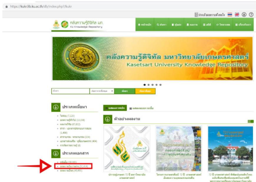
ภาพประกอบ 2 เว็บไซต์คลังความรู้ดิจิทัล มหาวิทยาลัยเกษตรศาสตร์ (Kasetsart University, 2018)

ตัวอย่างคลังสารสนเทศสถาบันของมหาวิทยาลัย เช่น คลังความรู้ดิจิทัล มก. ของมหาวิทยาลัยเกษตรศาสตร์ ได้รวบรวมผลงานวิจัยและองค์ความรู้ด้านการเกษตรกว่า 200,000 รายการ จัดเก็บทรัพยากรสารสนเทศประเภทต่าง ๆ เช่น ผลงานวิจัย หนังสือ ตำรา และบทความด้านการเกษตรของประเทศไทย เพื่อเผยแพร่และใช้ประโยชน์ในการพัฒนาการเกษตรของประเทศ และเพื่อให้เกิดการส่งผ่านองค์ความรู้ด้านการเกษตรสู่สาธารณชน จึงได้ทำการพัฒนาระบบคลังความรู้ดิจิทัลด้านการเกษตร โดยผลงานที่ได้รับการบันทึกในระบบคลังความรู้ดิจิทัลด้านการเกษตร จะเผยแพร่ไปยังเครือข่ายสารสนเทศด้านการเกษตรในระดับนานาชาติ และเผยแพร่ผ่านระบบเข้าถึงแบบเสรีที่โปรแกรมค้นหาสามารถเข้าถึงได้ (Aree Thunkijjanukij, 2017) โดยในคลังความรู้ดิจิทัล มก. มีวารสารอิเล็กทรอนิกส์และบทความวิชาการทั้งภาษาไทยและภาษาอังกฤษด้านการเกษตรของมหาวิทยาลัยเกษตรศาสตร์ มีวารสารจำนวน 40 ชื่อเรื่อง บทความวารสาร 31,414 รายการ (ข้อมูลวันที่ 30 ตุลาคม 2561)