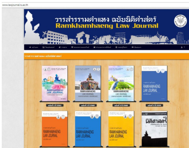
ภาพประกอบ 1 เว็บไซต์วารสารรามคำแหง ฉบับนิติศาสตร์ (Ramkhamhaeng University, 2018.)

ตัวอย่างวารสารเข้าถึงแบบเสรีลักษณะแบบข้อเดียว เช่น วารสารรามคำแหง ฉบับนิติศาสตร์ เป็นวารสารของคณะนิติศาสตร์ มหาวิทยาลัยรามคำแหง มีจุดมุ่งหมายเพื่อให้เป็นสื่อกลางในการเผยแพร่บทความทางวิชาการ บทความวิจัยและบทความวิจารณ์หนังสือในสาขาวิชานิติศาสตร์ การนำเสนอบนเว็บไซต์จึงมีเพียงวารสารรามคำแหง ฉบับนิติศาสตร์เท่านั้น โดยให้ข้อมูลเกี่ยวกับวารสาร วัตถุประสงค์ ขอบเขต ข้อกำหนดการตีพิมพ์ และเนื้อหาวารสารที่มีบทความในรูปแบบอิเล็กทรอนิกส์ที่สามารถเข้าถึงแบบเสรีโดยดาวน์โหลดไฟล์เอกสารและสิ่งพิมพ์เอกสารได้ เป็นต้น