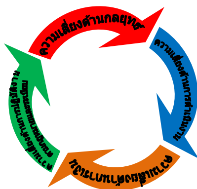
ภาพประกอบที่ 2 รูปแบบการบริหารความเสี่ยงของสถานศึกษา

3. การประเมินรูปแบบการบริหารความเสี่ยงของสถานศึกษา มีความเหมาะสม และความเป็นไปได้ในการนำไปสู่การปฏิบัติอยู่ในระดับมาก เมื่อพิจารณาเป็นรายข้อพบว่า เห็นด้วยในระดับมากทุกข้อ