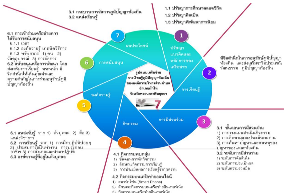
ภาพประกอบ 2 รูปแบบเครือข่ายการเรียนรู้ภูมิปัญญาท้องถิ่นขององค์การบริหารส่วนตำบล

จากตาราง 2 แสดงให้เห็นว่า องค์ประกอบหลักมีความเป็นไปได้ในรูปแบบไปปฏิบัติโดยรวมอยู่ในระดับมากที่สุด ( \bar{X}= 4.57 ) เมื่อพิจารณาค่าเฉลี่ยรายองค์ประกอบ พบว่า องค์ประกอบที่มีค่าเฉลี่ยสูงสุด เรียงตามลำดับ ได้แก่ ปรัชญา แนวคิดและหลักการของเครือข่าย ( \bar{X}= 4.86 ) การเรียนรู้ ( \bar{X}= 4.71 ) การมีส่วนร่วม ( \bar{X}= 4.71 ) กิจกรรม ( \bar{X}= 4.71 ) องค์ความรู้ ( \bar{X}= 4.43 ) การสนับสนุน ( \bar{X}= 4.43 ) และผลประโยชน์ ( \bar{X}= 4.14 ) ในภาพประกอบ 2